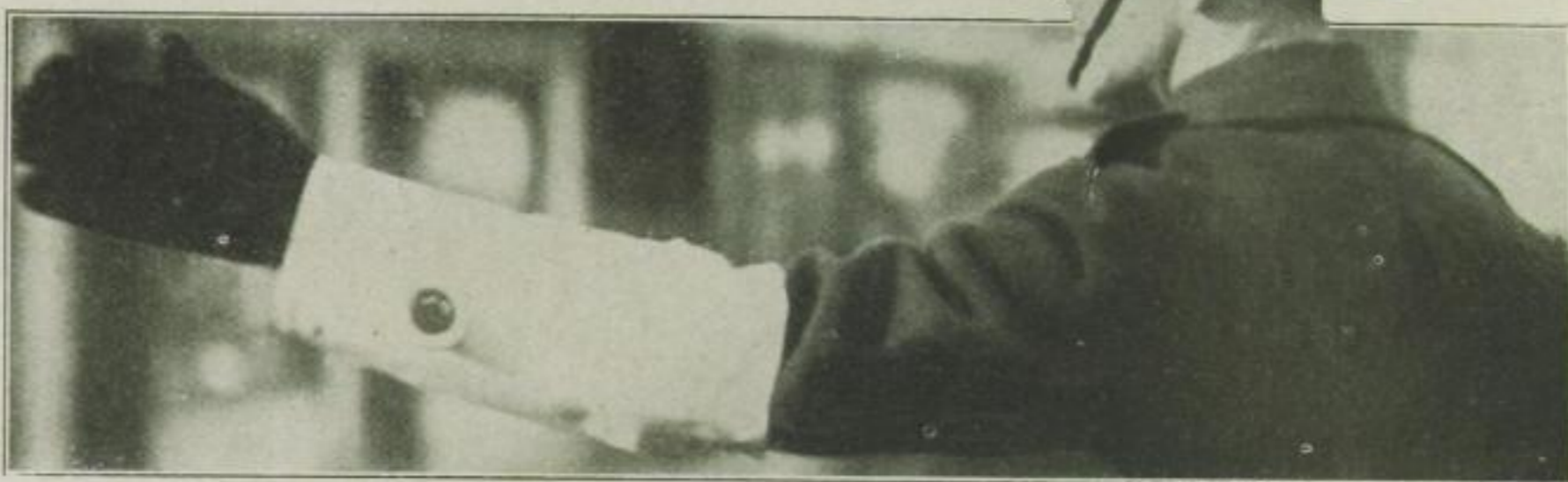
Um in der Dunkelheit gesehen zu werden, sind die weißen Armbinden der Verkehrspolizisten mit roten Lämpchen versehen, die weithin leuchten