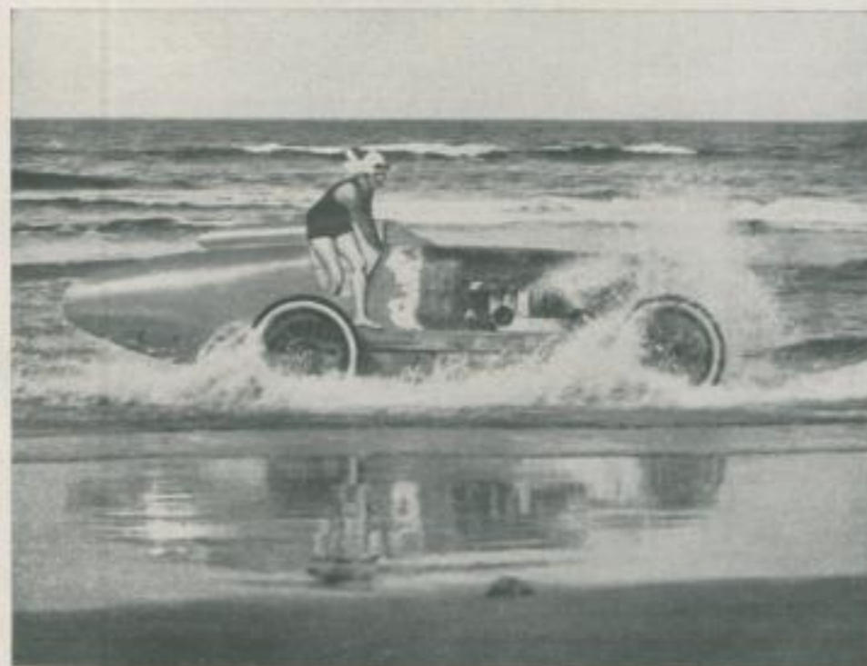
Eine Teilnehmerin, deren Maschine in Brand geriet — im Augenblick, wo sie sich durch Abspringen rettet . . .

Das Rennen selbst war reich an Zwischenfällen, die Teilnehmer folgten den Wagen auf Rennbooten, das Ziel war eine weitentlegene Buhne, die der besseren Kenntlichkeit halber siegellackrot angestrichen war und unter blauem Himmel, auf grünem Wasser liegend, einen weithin erkennbaren prachtvollen Farbeffekt erzielte. Unsere Bilder sind Spezialaufnahmen eines Teilnehmers, der in einem Rennwagen am Strande den Konkurrenten folgte, und dem es gelang, einige der schwierigsten Situationen, wie beispielsweise den in Brand geratenen Wagen, und die aus dem Wagen springenden Teilnehmerinnen im Bilde festzuhalten.