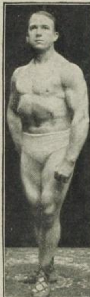
Strongfort, das Ideal männlicher Vollkommenheit.

Beachten Sie dieses Alarmzeichen der Natur! Lassen Sie es nicht bis zum völligen Verlust der Manneskraft kommen! Sonst wird Ihre Ehe eine Tragödie für Sie werden. Wenn Ihre Ehe glücklich sein soll, müssen Sie ein vollwertiger Mann sein, eine energiegelbe Persönlichkeit, Sie müssen mutig und tatkräftig sein, lebhaft und fröhlich, gesund und stark. Durch