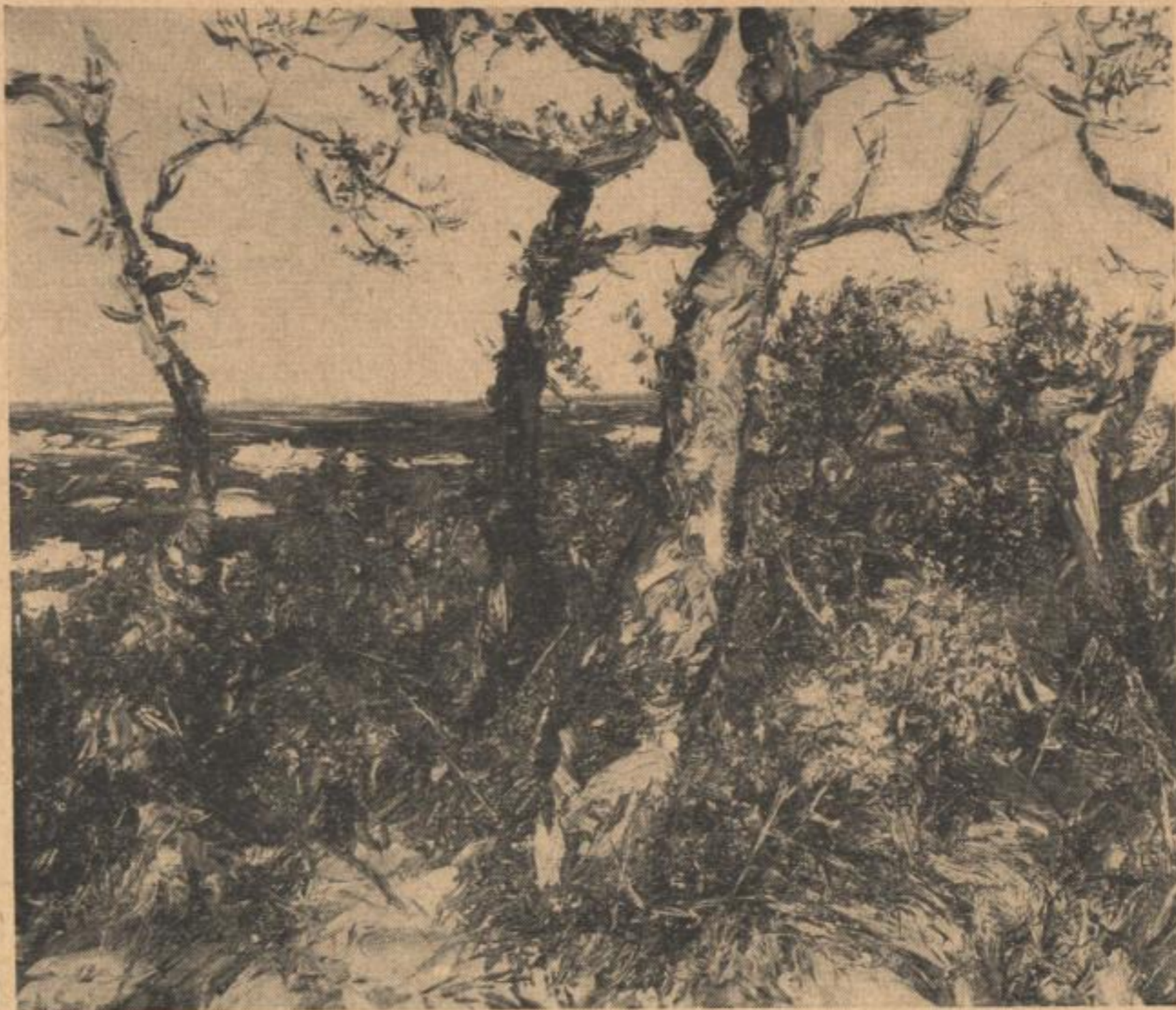
A. v. Szpinger „POMMERSCHE LANDSCHAFT“