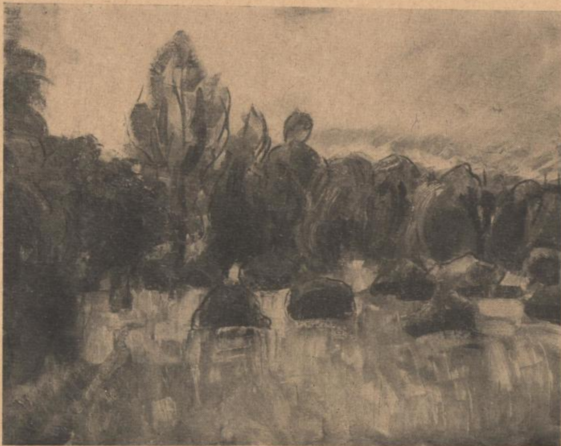
Alfred Ahner „AUF- STEIGENDES GEWITTER“