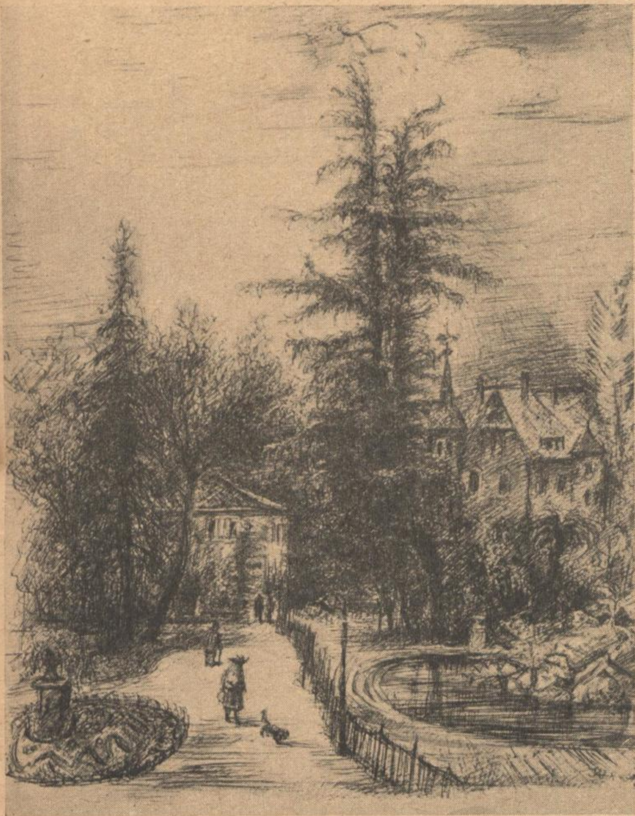
Martin Jahn „PARKLANDSCHAFT MIT GRÖSSTER CEDER“ Federzeichnung