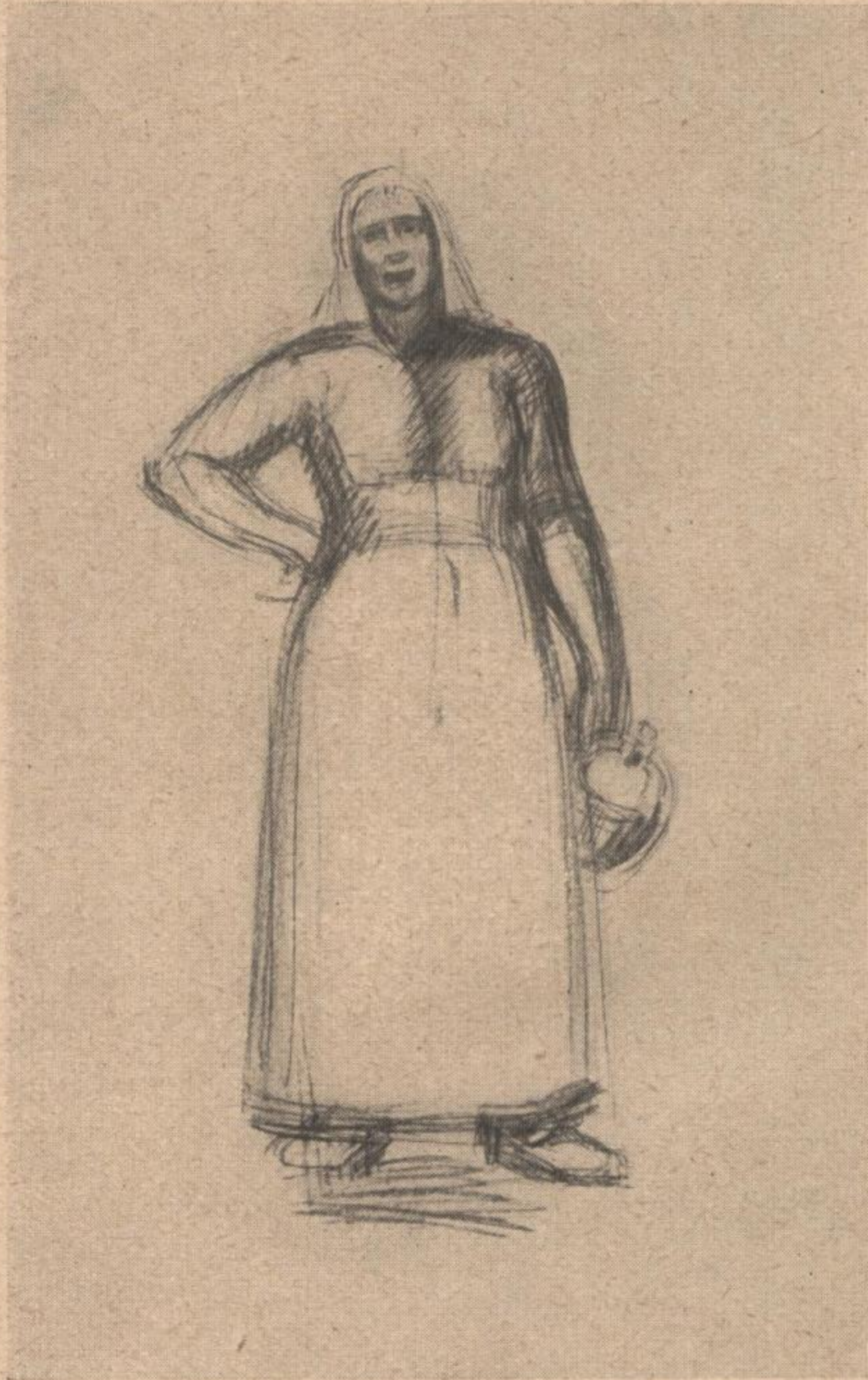
Karl Meusel „FRAU MIT KRUG“ Bleizeichnung