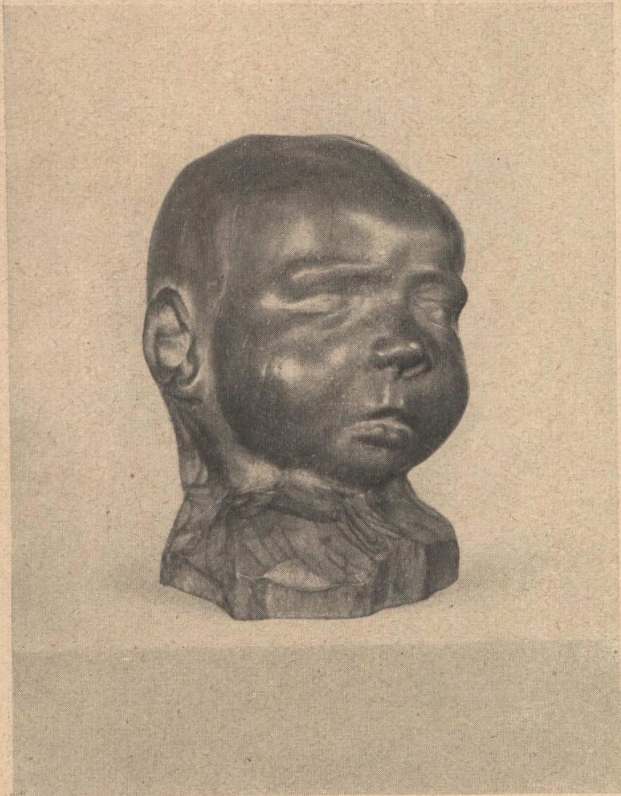
Erich Dietz „KINDERKOPF“