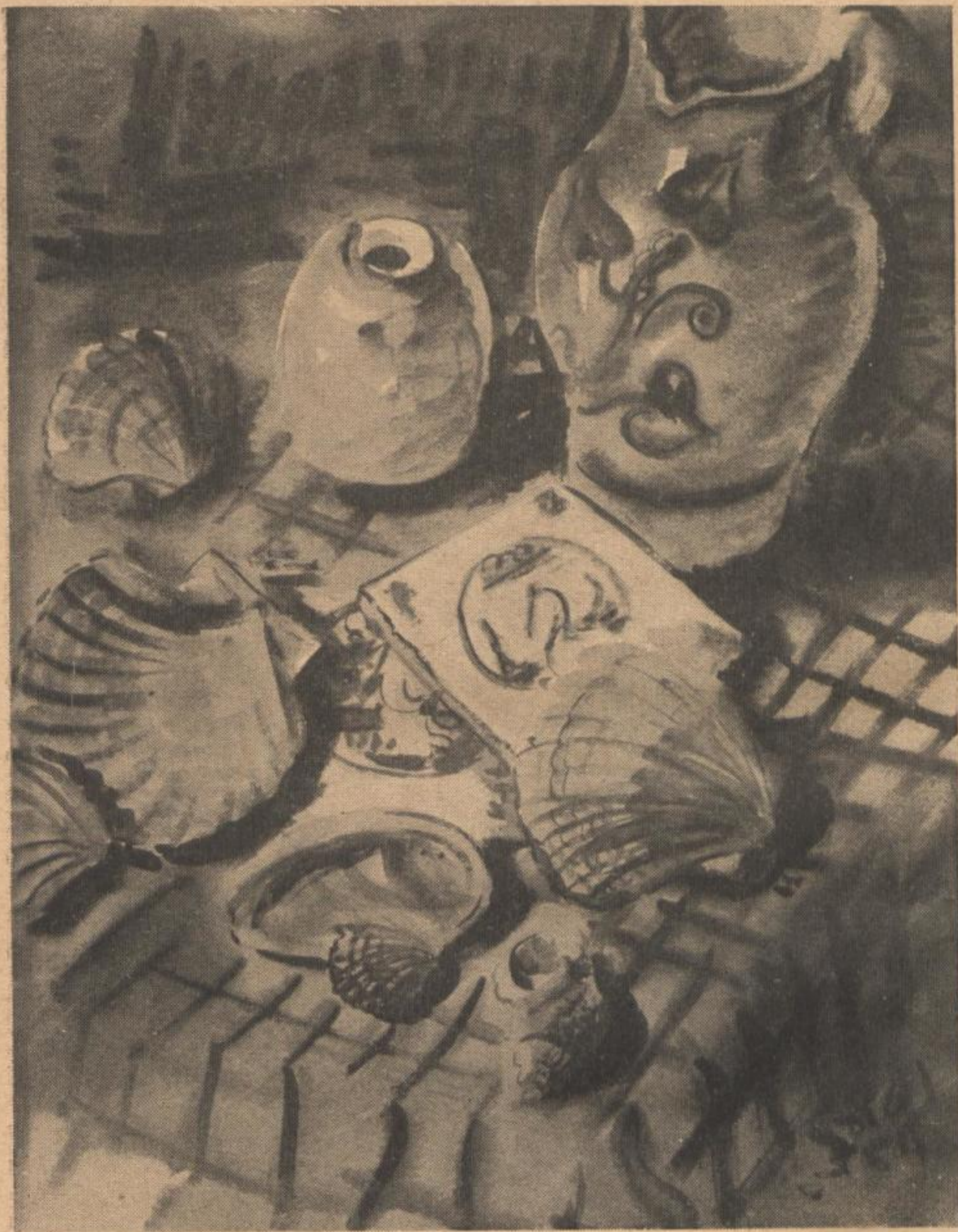
Rudolf Saal „STILLEBEN MIT KRUG“