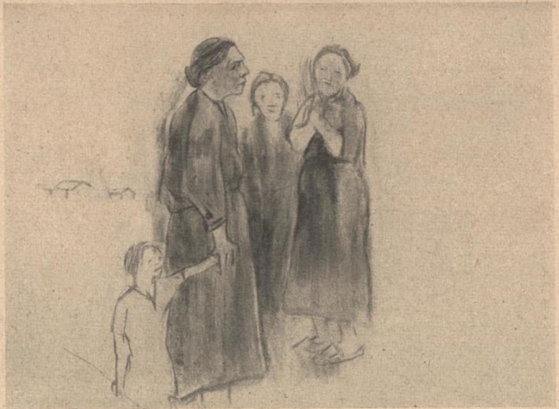
Walter Heider „FISCHER- FRAUEN“ Aquarell