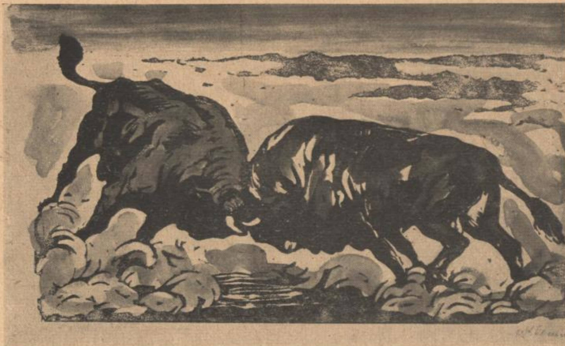
Walter Klemm „STIERKAMPF“