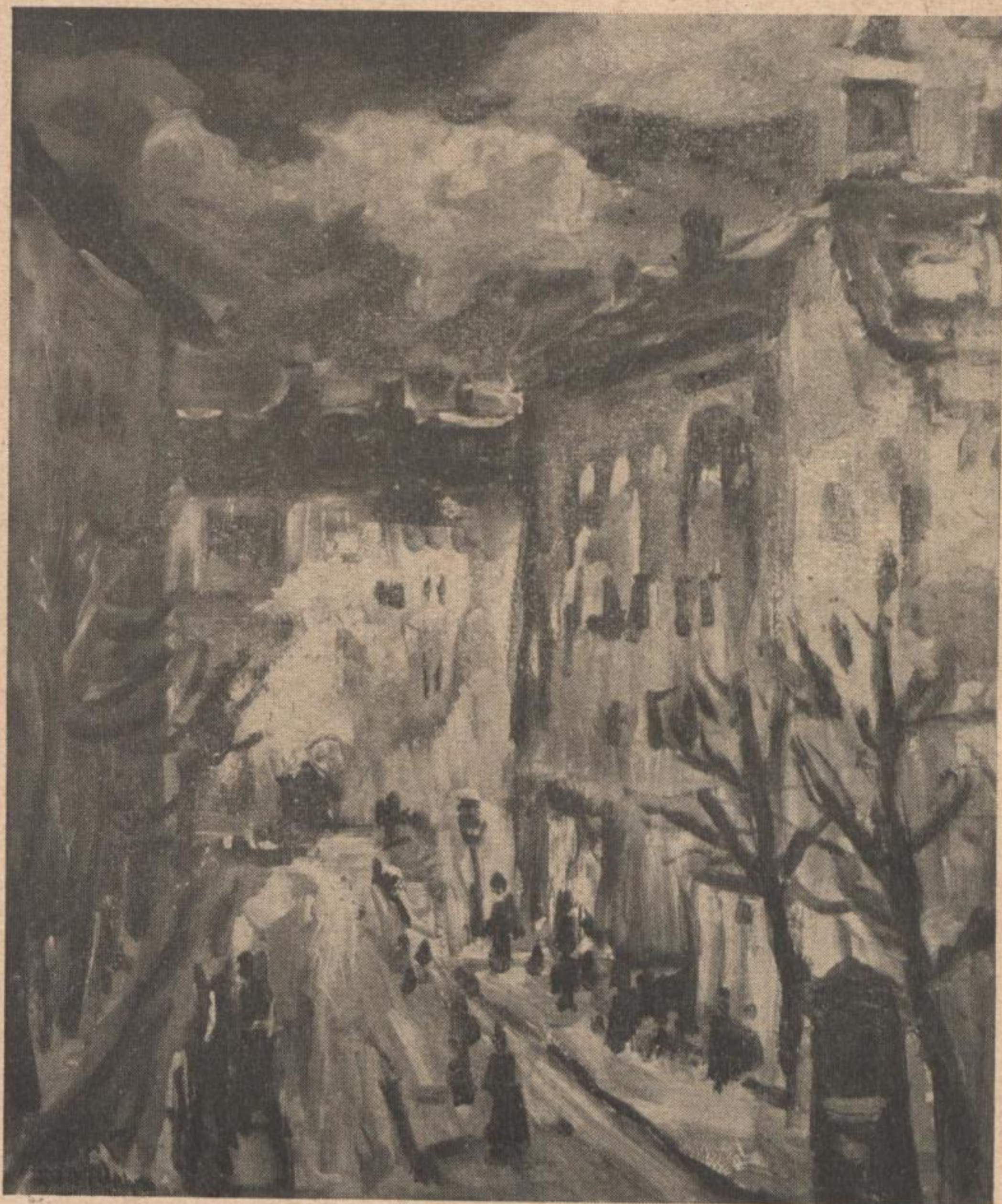
A. Wolfgang „NÄCHTLICHE STRASSE“