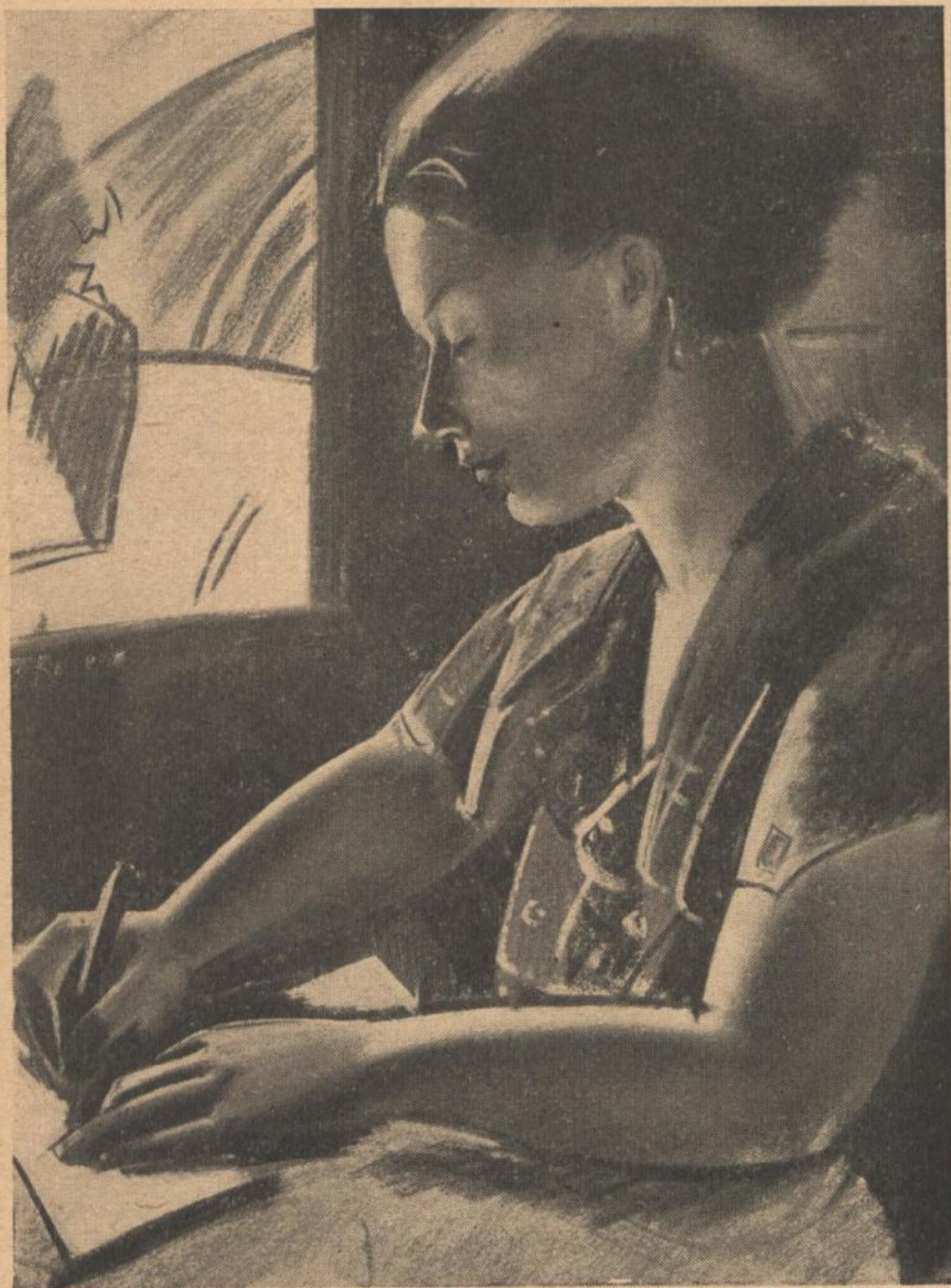
Otto Herbig „SCHREIBENDE AM FENSTER“