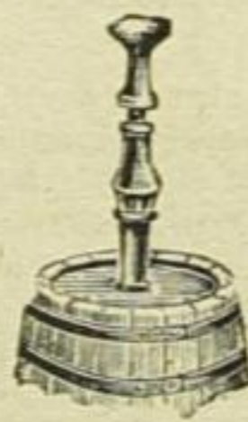
F 1a — Preis M 6.50.

Diese Korkmaschinen F 1 und F 1a haben lange Gehäuse, wodurch hoher Hub des Stempels gestattet und ein leichtes Eintreiben des Korkes ermöglicht ist. Die Mündungsweite kann nach Belieben hergestellt werden.