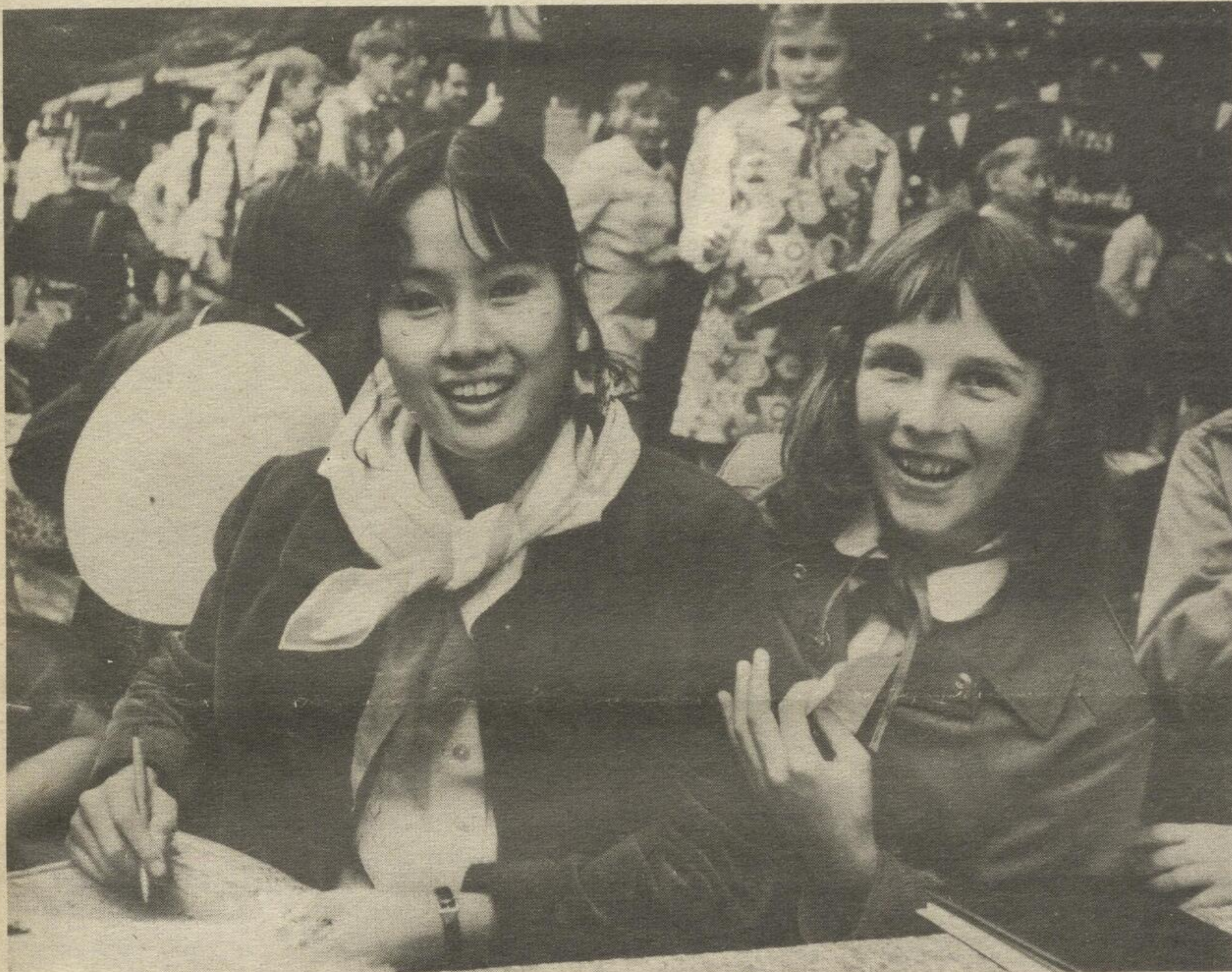
Die XXXI. Vollversammlung der UNO hat das Jahr 1979 zum Internationalen Jahr des Kindes erklärt. Eine Weltkonferenz „Für eine friedliche und gesicherte Zukunft aller Kinder“ wird stattfinden. Bedroht sind Leben und Zukunft der Mädchen und Jungen Vietnams. Deshalb: Schluß mit der Aggression gegen das sozialistische Vietnam!