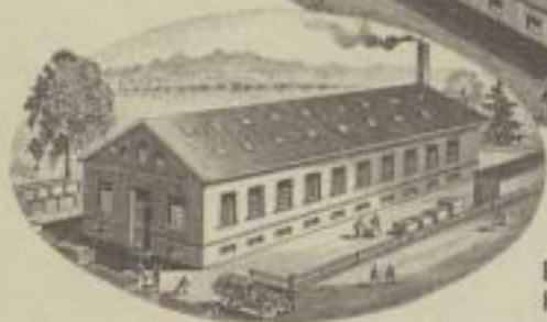
FABRIK IN HEILSBRUNN, THÜR.

ZAHLSTELLEN: REICHSBANK GIRO-KONTO ZWICKAU SA. STADTBANK PLANITZ SA.