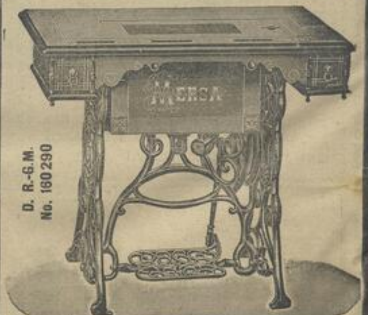
D. R.-G.M. No. 160290

Biesolt & Locke's Familien-Langschiff-Nähmaschine.