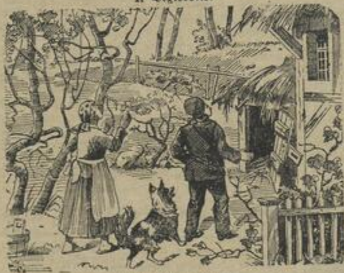
Wo ist das Schwein?