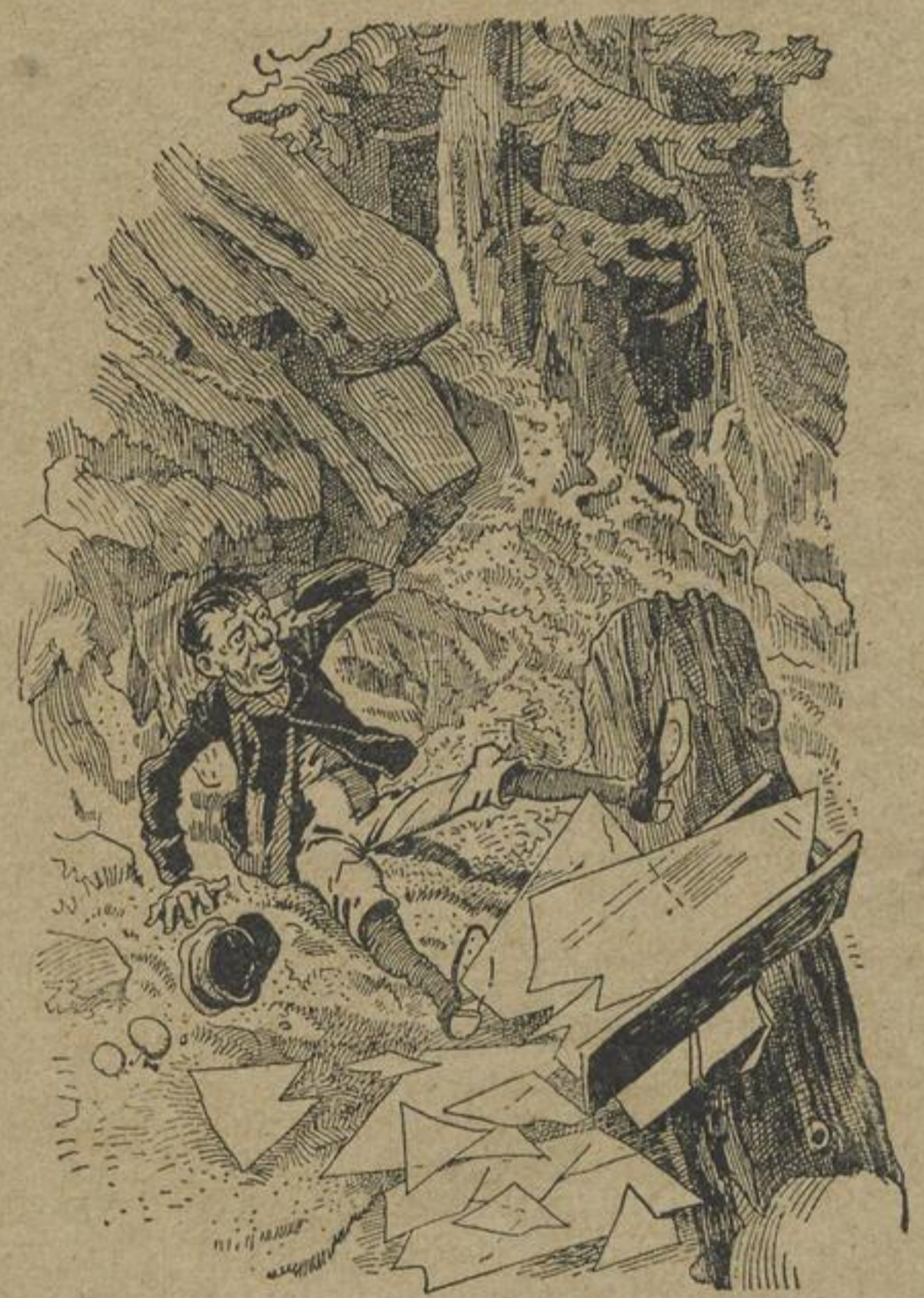
Wo ist Mübezahl?