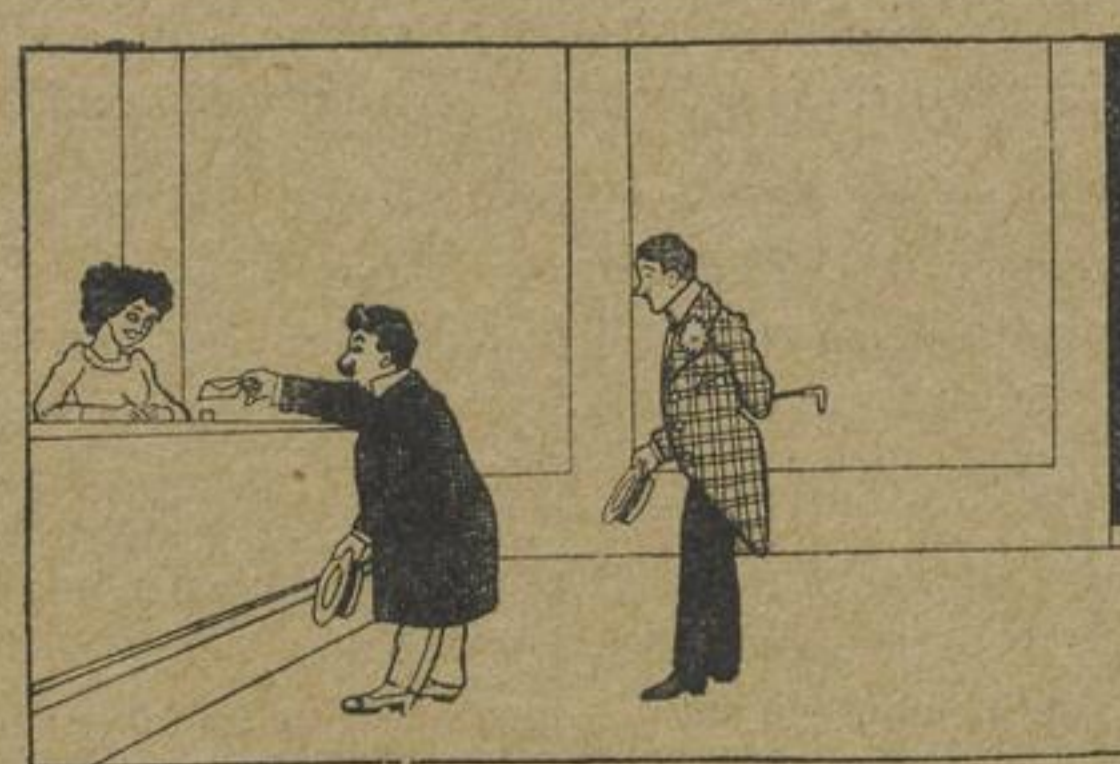
Geziatzen Sie, mein Fräulein,...

Dame (zu einer Freundin): „Dein Mann hat also die Jagerei aufgegeben und ist jetzt bringt er mehr Viehzeug nach Hause, als wie er noch Jäger war!“