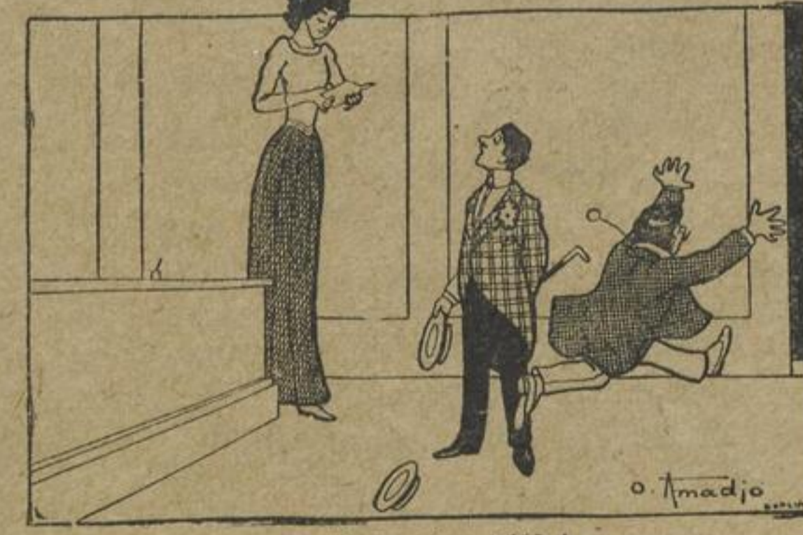
Zu Hilfe! Zu Hilfe!