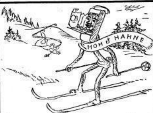
Photo-Apparate u. Zubehör

LEIPZIG Tröndlinring 3 Ecke Nordstraße Grimmische Str. 8 1-3. Stock. Gegenüber dem Naschmarkt.