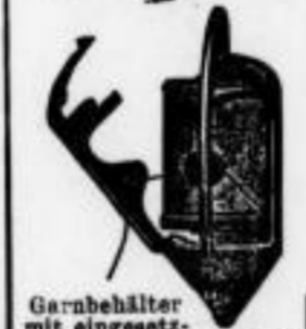
Garnbehälter mit eingese- tzter Unter- fadenrolle in verkleinertem Maßstab.