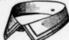
LINCOLN B Dtsd. M. -55.