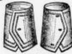
WAGNER Dtsd.-Paar M. 1.20.

Fabriklager von Mey's Stoffkragen in Eibenstock