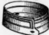
FRANKLIN Dtsd. M. -90.