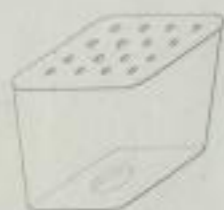
Détail d'une des poteries de plancher.