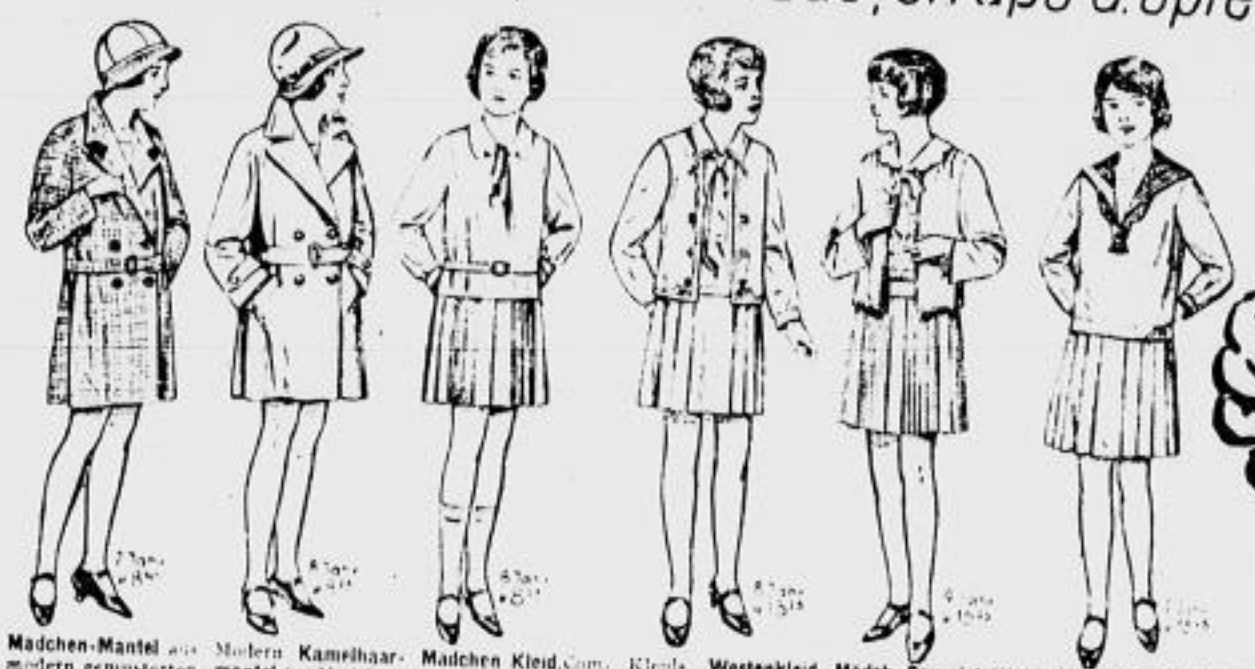
Mädchen-Mantel aus modern gemusterten Frühlingsstoff, Rundgürtel u. Tasche 6 Moderner Kamelhaar-mantel für Mädchen, Sportform, Rücken- falte, Sattel, 12 bis 14 Jahre 14 Mädchen Kleid, Comp. pose, 4 remsellosem Popeline, mit Rück- und Schlitze für 12 bis 14 Jahre 4 Kleids. Westenkleid f. Mädchen, remsel- los, Popeline, Weste aus m. Karbottick, 12 bis 14 Jahre 7 Mädch.-Complet, Kleid u. Jacke Bluse meist ge- must. Rückchen pliss. Bubikr. Schleife 12 bis 14 Jahre 9 Matrosenkleids. Ma- chen in versch. Grö- ßen, Ausf. ab 12 bis 14 Jahre 12 Knaben-Hosen, blaufarbig, Manchester u. Cord, in allen Größen u. Preislagen reichsortiert am Lager