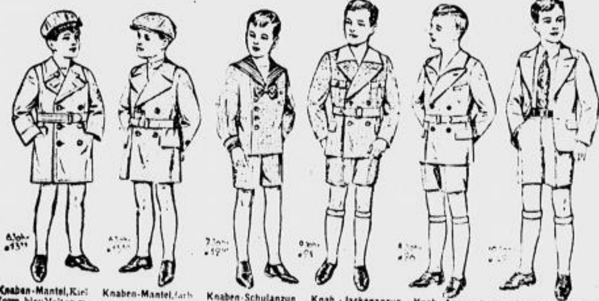
Knaben-Mantel, Kiel- Form, blau-Melton m. Rappdg. f. 8 bis 12 Jahre 9 Knaben-Mantel, farb- gemustert mit Rund- gürtel, ganz gemust. 12 bis 14 Jahre 11 Knaben-Schulanzug, Matrosenform, prakt. gem. Stoff, Hose ganz gefüttert, nur ab 12 Jahre 8 Knab.-Jackenanzug, Kammerermodell, gem. Stoff, in mod. Farb- gamengef. f. 12 bis 14 Jahre 16 Knab.-Anzug, Jack- Form, in blau, ohne, mit weißer Kragen- streife, 12 bis 14 Jahre 21 Knaben-Anzug, mit Hemd u. Sportgürtel, in mod. Farb- gamengef. f. 12 bis 14 Jahre 32 Mädchen-Hut aus modern. Phantasiegestalt mit Ribband garniert, besonders preiswert 1 Mädchen-Hut aus Phantasiestroh, mit netter Seidkerze, leucht. Glocken- form 2 Mädchen-Hut aus modern gelacktem Ge- flecht, kleidsame Form mit Randgarnitur 4 Mädchen-Hut feine Glockenform, aus Stroh, schone Farben, flotte Glat- tur, besond. kleidsam 3 Sportmütze für Knaben, verschied. moderne Muster, besonders preis- wert 1 Matrosenmützen mit Schriftband, verschiedene Qualitäten 1 Mädchen-Taghemd in voll. Achsel, in Stoff u. Mo- re, cam. bis preisw. 0 Knaben-Taghemd in voll. Achsel, in Stoff u. Mo- re, cam. bis preisw. 1 Mädchen-Prinzebrock feintad. Wachsbest. in andr. voll. Stoff, Vedant 0 Schulschürze Hängertorm, weiß glatt, Batist, in St. u. remsellosem Stoff, 1 Schulschürze Hängertorm, aus hant gemust. Frachtkost., Rückh. ein- f. blau Blendenabschl. 1 Schulschürze Hängertorm, schwarz, und hant gemust. Satin, nett verarb. mit Blind. hex. 0 Kinder-Strümpfe Baumwolle, 1 x gestrickt, richtig lang, farb., 0 Kinder-Strümpfe pa. Mako, fein gestrickt, schwarz u. farbig, 0 Kinder-Strümpfe pa. Mako, mit Lammasie- od. glatt. flach. Sohle, 0 Knaben-Schirm Makoherg auf Holzstock, halbsch. front. versch. Grö- ßen, einfache Ausf. 3 Mädchen-Schirm praktischer Bezug, durch- gemustert und ein- farbig 4 Mädchen-Schirm Kunst- und Halbsch. Nubsch. bontes Streifenmuster 5 Kinder-Spangenschuh schwarz Kindbox, prakt. Straßen- schuh, besond. preiswert 5 Kind.-Lackspangensch. bequemste Form, in kleiner Vergrößerung, gest. Angebot 5 Kind.-Schnürhalbschuh schwarz Kindbox, breite Form mit Kappo, Derby schritt 6 Kind.-Schnürhalbschuh farbig mit braun Box, als kom- biniert, besond. preiswert 6 Kind.-Schnürhalbschuh braun Kindbox, bequem Form, Derbysch. fest. Straßen- schuh, 6 Kinder-Spangenschuh feinfarb. Cleverant, braun Box, kalt-garn. pa. Qual. 11