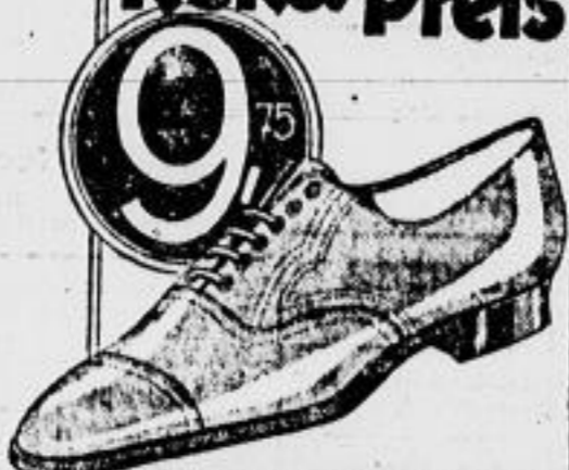
Original-Goodyear-Welt braun Boxkalf Herren-Halbschuhe