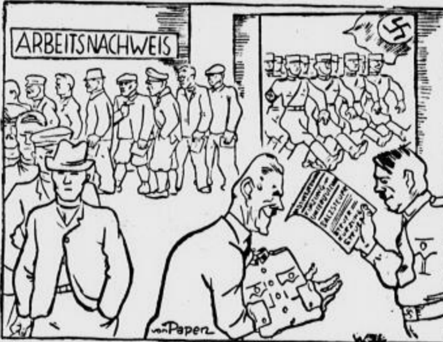
Das ist Papens Wohlfahrtsstaat

Immer neue Massennot bringt das kapitalistische System für die Aermsten der Armen. Der einzige Ausweg, um das Elend zu beseitigen, ist der außerparlamentarische Massen-