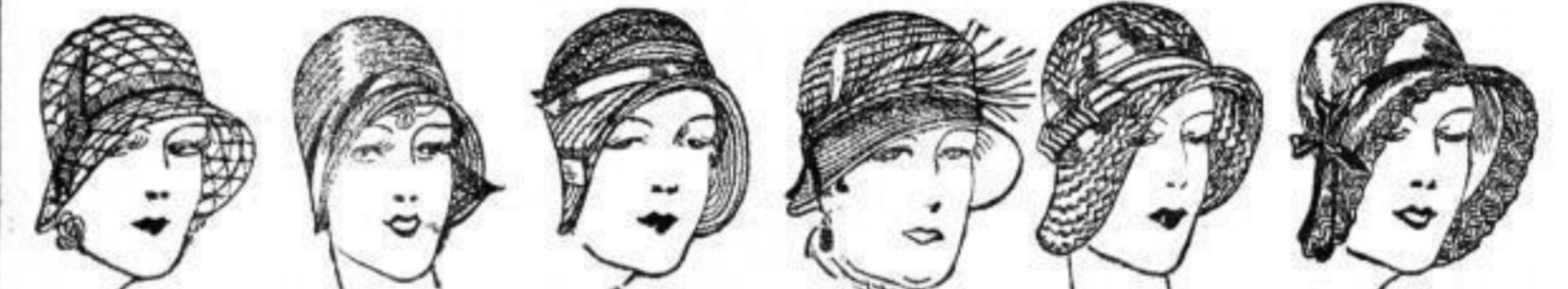
Hut aus Phantasieborte, jugendl. Glocke, mit einfach. Bandgarn. 3.75 Hut aus leichtem Geflecht, flotte Bandgarnitur, schmale Glocke M. 4.75 Hut, Phantasiestroh, mit durchbroch. Eins., Aufschlagform M. 6.75 Hut, kleidsame Frauenform, farbige Unterblende u. Reiter M. 7.75 Hut aus Kriechborte, mit Stroh bekurbelt, leicht im Tragen M. 9.75 Hut aus Stroh und Krinelspitze, flotte Glockenform ..... M. 12.75

Zahlung kann erfolgen bei Kauf der Ware unter Kürzung v. 3% Skonto oder ohne jeden Aufschlag in 4 aufeinanderfolgenden Monatsraten | Unsere Versandabt. erledigt umgehend alle Bestellungen