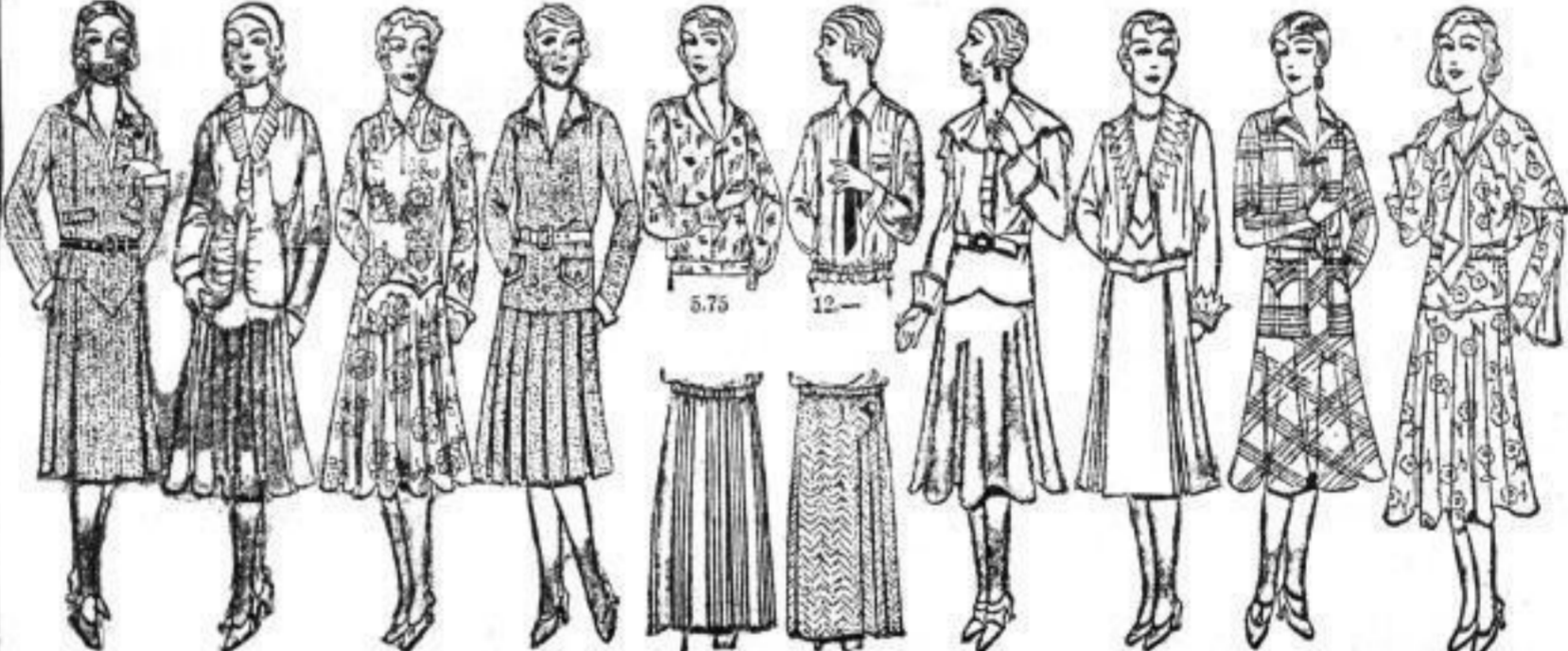
Feuch. Sportkleid, Tweed, mit Ripsweste und kleinen Taschen versehen ..... M. 18.50 Jugendliches Kleid, Kunstseid. Marocain modern gezeugenes Ober- und rückwärts zum Bind. 24.- Kleid aus gemust. Trikot Charmeuse, mod. Glockenrock, einfarbige Seidenfäden. 26.- Kleid, reine Wolle, mit Ledergürtel, flotte Sportform, Crêpe de Chine - Garnitur. .... M. 29.- Kasak, bt. gemust. Kunstwaschseide M. 5.75 Kleiderrock, reine Wolle, Gruppen-Pflege 5.75 Bluse, Trikot-Char.-meuse Charm.-Bluse von M. 5.50 an Kleiderrock, Sommerstoff. .... M. 7.- Kleid, Crêpe Caïd, versch. Farb., kleids. Pelermantelkrag, Rock reiche Glocke. .... M. 34.- Seidenkleid, neue Boleroform, aparte Georgette-Garnitur, Größe 42/46 ..... M. 38.- Nachmittagskleid, Crêpe à jour, aparte Farben, tief angesetzter Glockenrock. .... M. 44.- Elegant Kleid, gemustertes Marocain, mit Capeskragen, Georgette-Garnitur. .... M. 48.-