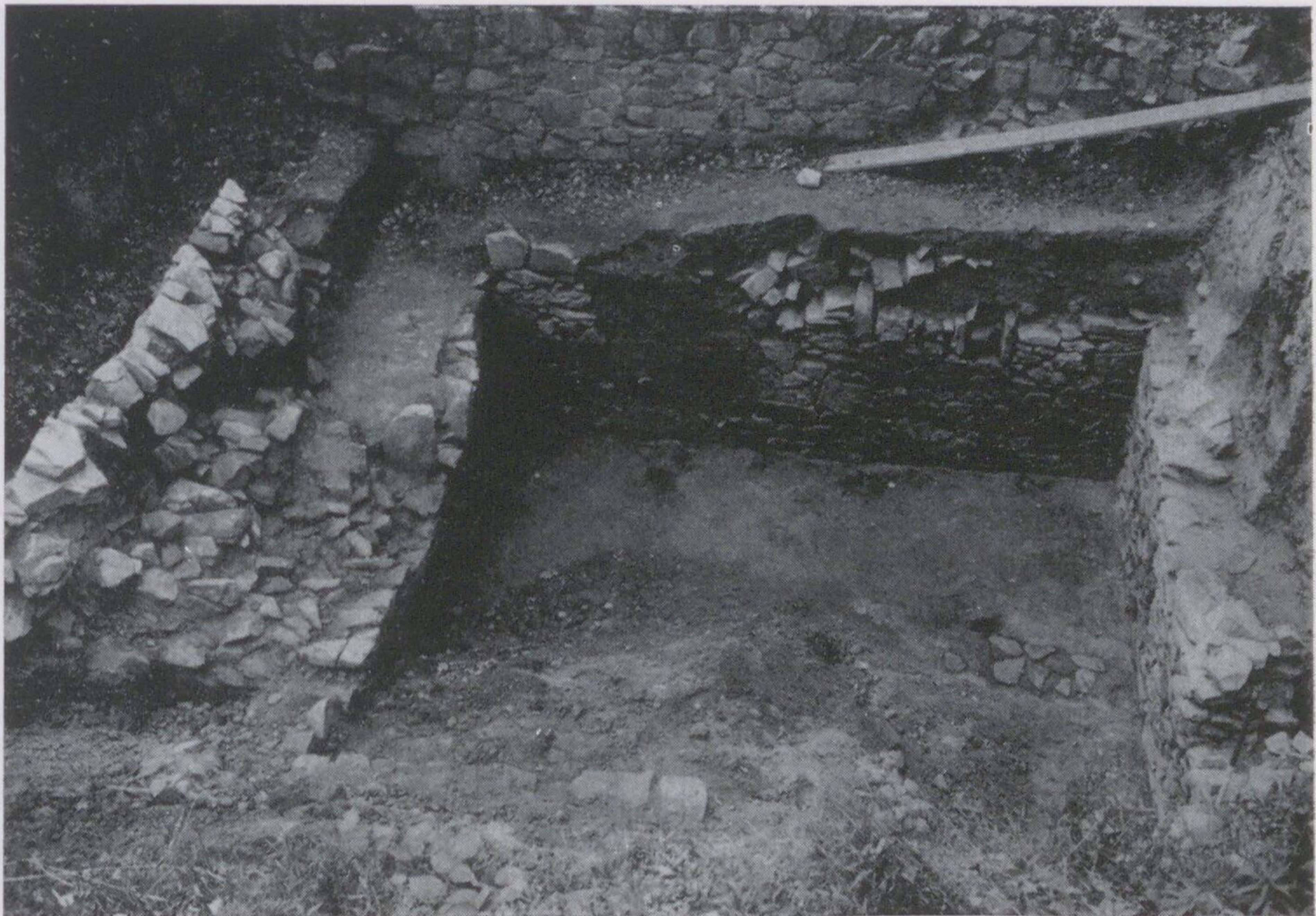
Abb. 23. Beerwalde, Kr. Hainichen, „Waal“. Mauerreste des Turmes von NO.