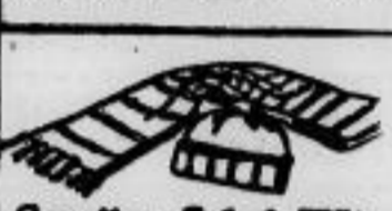
Gewebter Stoff 5.-