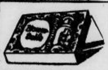
Geschäftskarten 50 Pf.