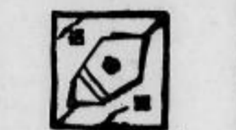
2 Ziertücher 80 Pf.