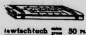
1 Tischschuch 50 Pf.

Während der Wintertage Sonderverkauf Bekleidung für Damen, Herren, Mädchen und Knaben zu ungewöhnlich billigen Preisen. - Unsere Schneider können Ihnen keinen günstigeren Überblick bieten, und wir bitten daher um Beachtung der Verkaufslagen. Viel Was liegt oder hängt überstülpt und mit Preisen versehen aus; außerdem ist das Personal angewiesen, Ihnen jeden gewünschten Artikel aus unserem sehr großen Sortiment ohne Rücksicht zu zeigen. - Es empfiehlt sich, für den Kauf und für die Bestätigung nach Möglichkeit die Wintertage zu benutzen.