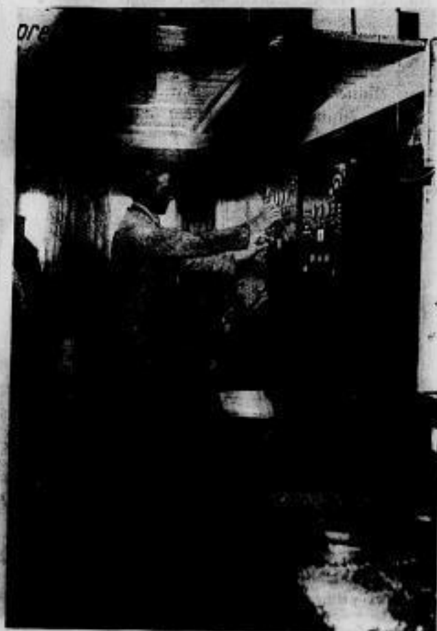
Modell eines Eisenbahnzuges mit Radio und drahtloser Telefonanlage.