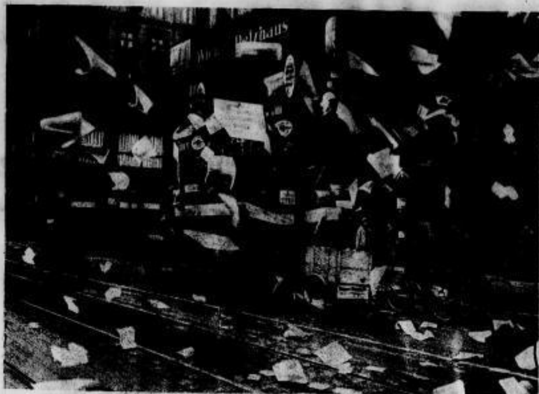
Die Wahlkampf in den Straßen Berlins.