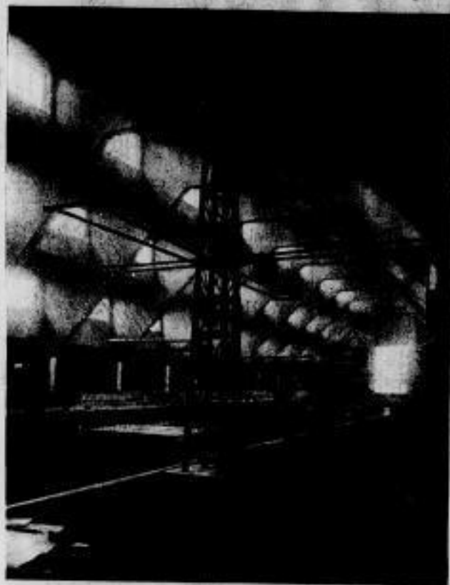
Modell der Rahmenantenne von Berlin-Zehlendorf.