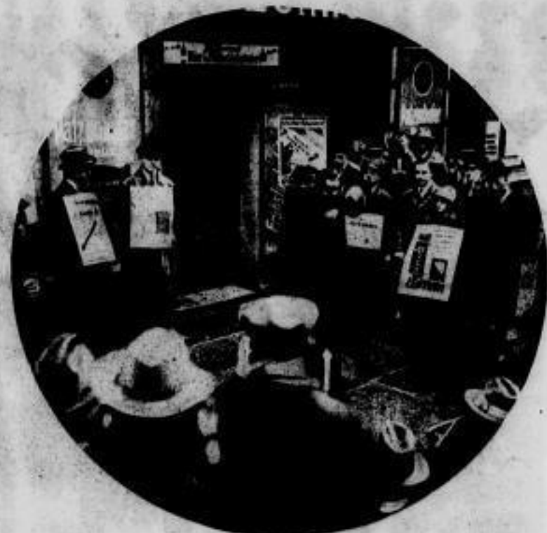
Reichspräsident Ebert beim Verlassen des Wahllokals nach der Wahl.