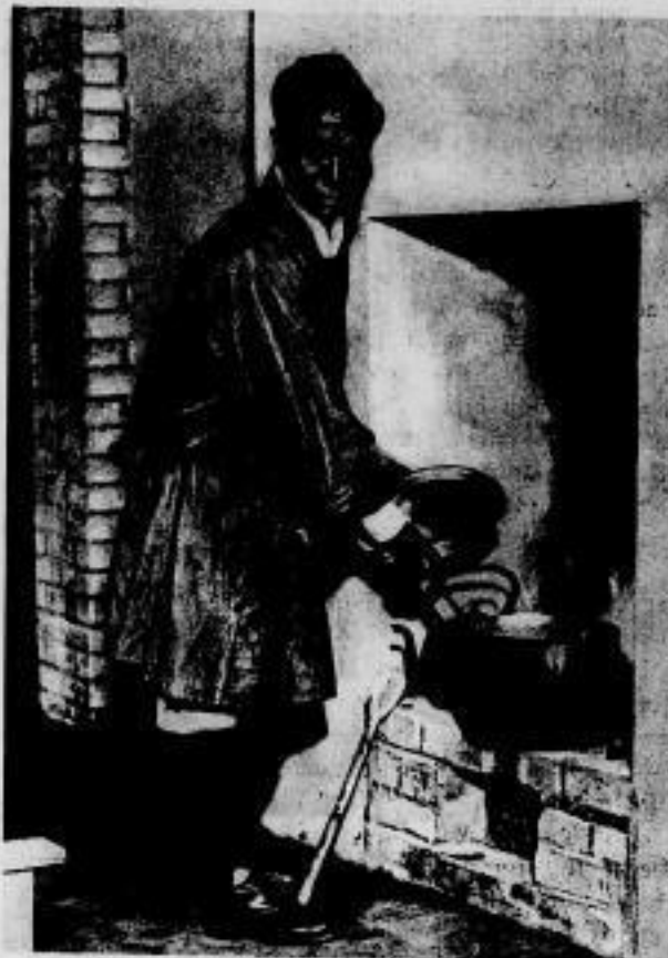
Das Haupt der tibetischen Lamas, der seinerzeit der Mount-Everest-Expedition als Führer diente.