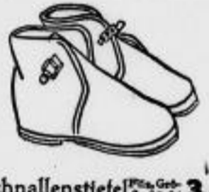
Schnallenstiefel für Herren, Größe 25-26 3.-