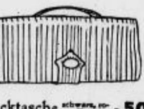
Lacktasche schwarz, mit Leder Futter, 5.-