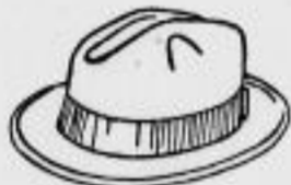
Herrenhut moderne Form aus Pa. b. n. 4.-