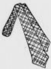
Selbstbinder Kunstseide mit Karos und Streifen 1.-