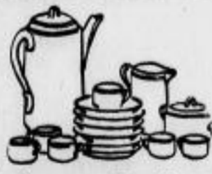
Kaffeesevice Porzellan 5.-