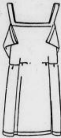
Prinzeßrock Kunstseide alle Farben 4.-

Man bediene sich bei Einkauf größerer Gegenstände im Bedarfsfalle unserer bekannten Anzahlungseinrichtung mit Warenrücklage bis zu 4 bzw. 6 Wochen.