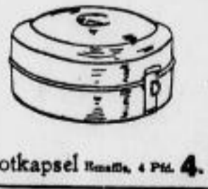
Brotkapsel Kunstseide, 4 Pl. 4.-