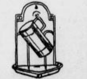
Konsole mit Maß Aluminium 1.-