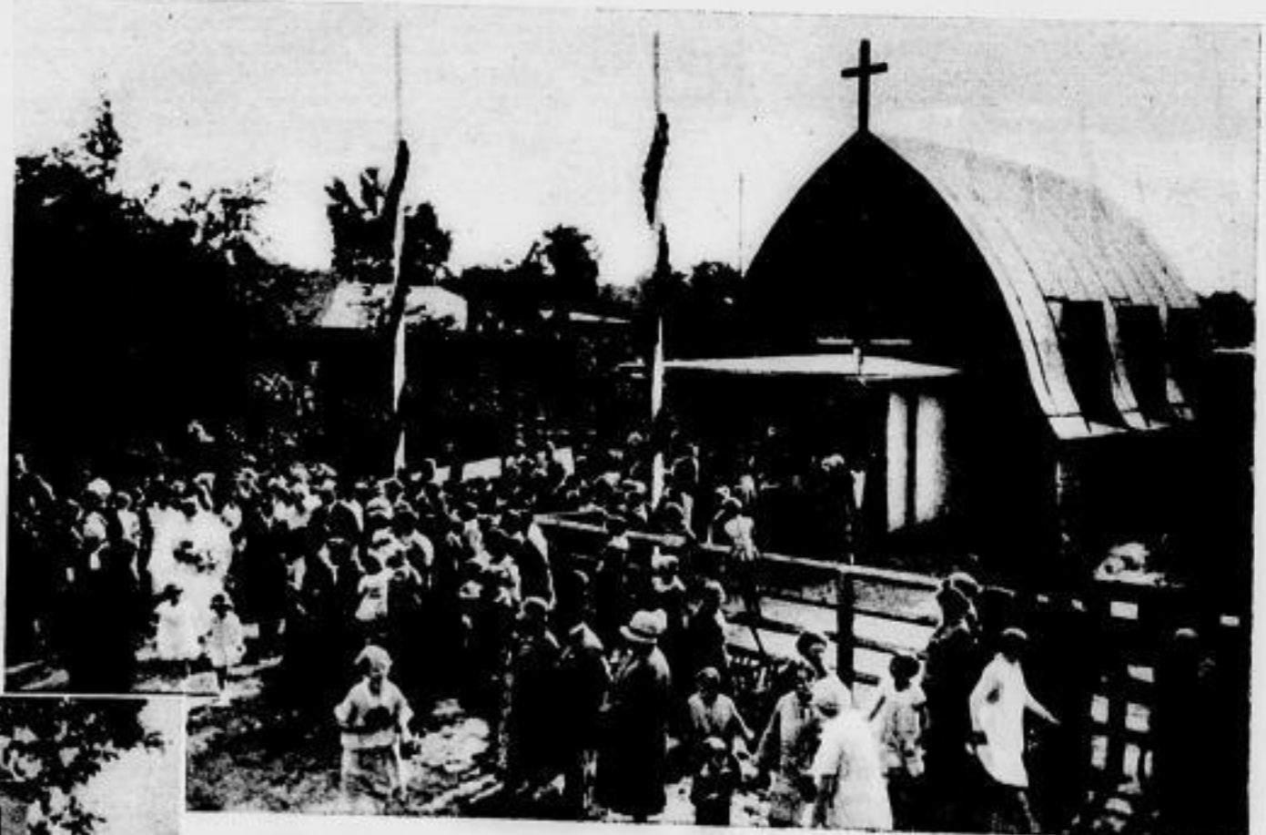
Die erste Wochenend-Kirche wurde von einer Kolonie bei Spandau aus eigenen Mitteln erbaut und bei der Hochzeitsfeier eines der Kolonisten geweiht. Neben der Kirche das Balstengerüst des Glockentürchens Deltus