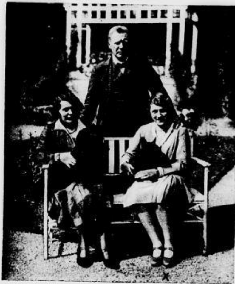
Der Tibetforscher Wilhelm Filchner, dessen Ermordung durch Räuberbanden vor einiger Zeit fälschlich gemeldet war, ist jetzt nach mühsamer Forschungsreise durch Turkestan, Tibet und Indien nach Deutschland zurückgekehrt. — Filchner mit seiner Tochter (x) und der Gattin des argentinischen Konsuls in München. Die beiden Hunde hat Filchner aus Tibet von seiner Reise mitgebracht