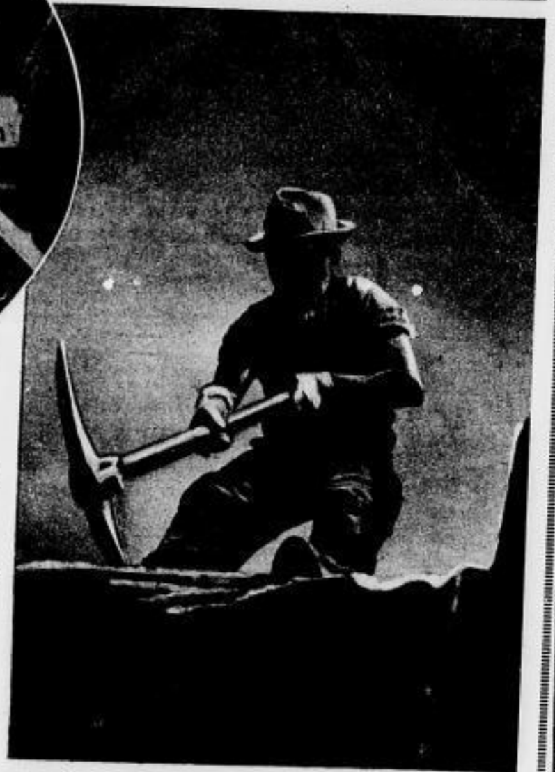
Bild unten: Das Chaos des Bauplatzes. Menschen und Pferde, die beiden Arbeitskameraden, werken vereint in Sonne, Regen und Wind

Bild rechts: Die Spitzhacke reißt den Boden auf