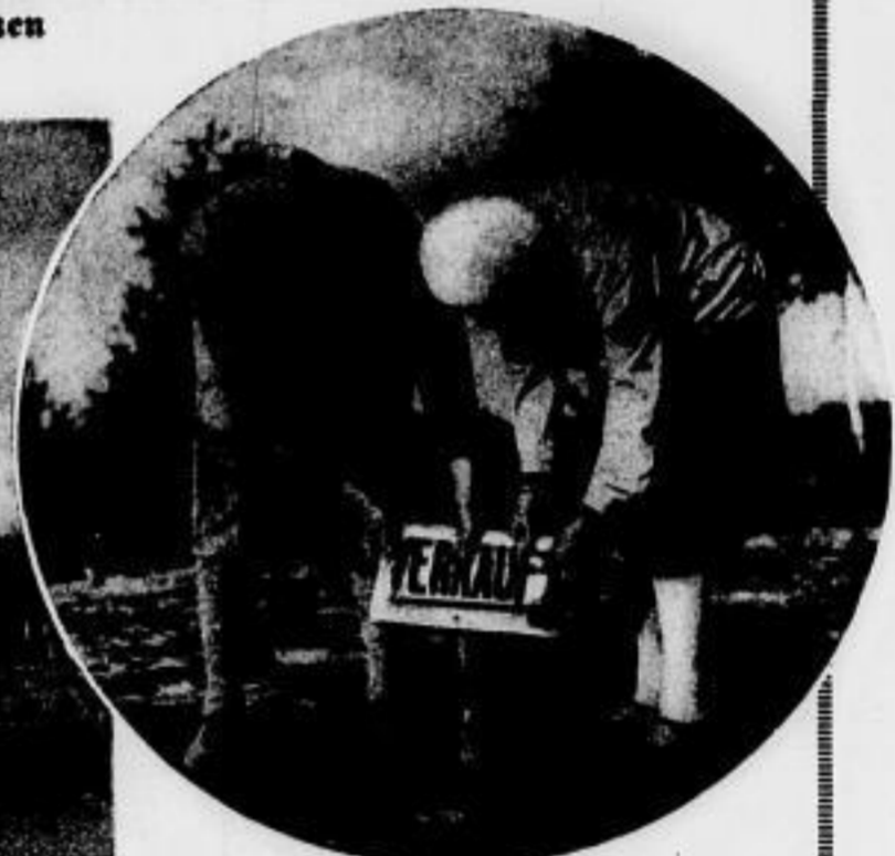
Das freudige Ereignis: Verkauf! — „Und wir sind die Besitzer!“