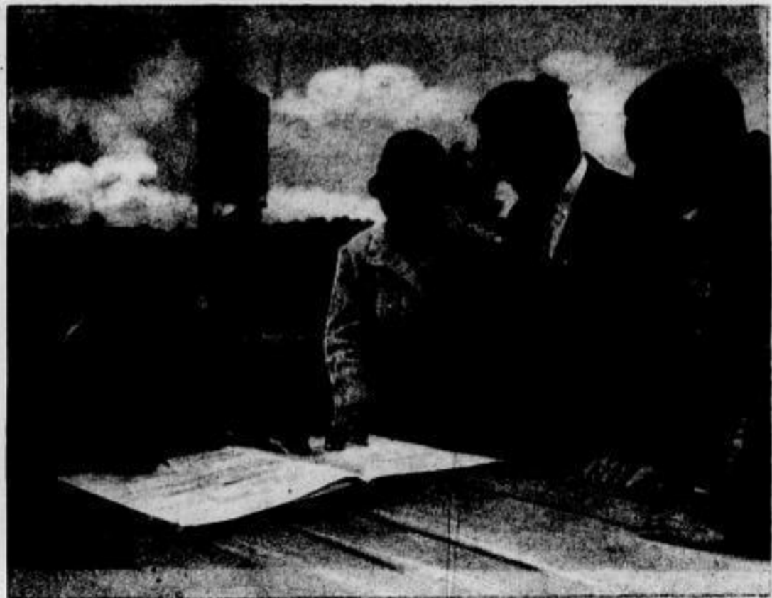
Die Eintragung der neuen Grundbesitzer

Ein Stückchen Land besitzen, ein winziges Stück Grund und Boden sein Eigen nennen, — die Sehnsucht Unzähliger, tief verwachsen im Heimatgefühl eines jeden. Nur wenigen ist es vergönnt, wenn auch modernes Siedlungsweisen da, wo genug Raum ist, wenigstens jedem ein Stückchen Grünfläche „vermietet“. Wer irgend kann, der wandert hinaus, „siedelt sich an“, fernab vom großen Arbeitszentrum. Ist erst der Boden sein, das Häuschen wird schon allmählich „wachsen“!