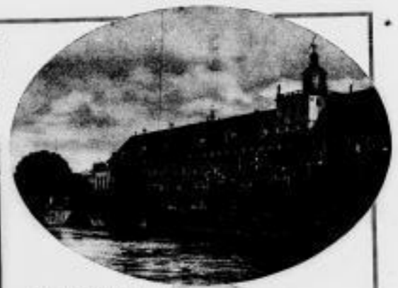
Die Kaiserlich-Königliche Königsburg, die Baracken von und bei deren Stelle am 18. Juli 1914