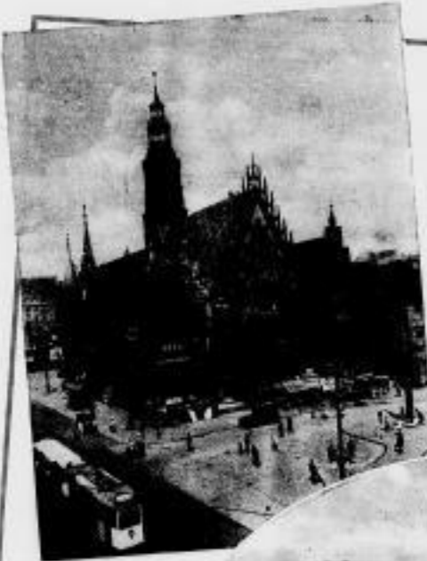
Das prächtige gotische Marienhaus mit dem Kling