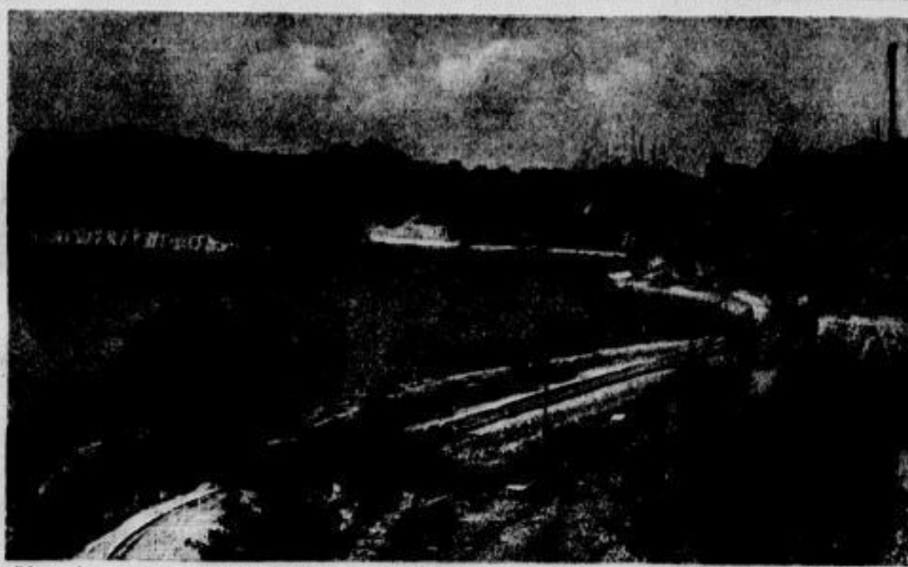
Hier hat die Technik neue Naturschönheit geschaffen. In einer alten Kalkgrube, deren Abbau eingestellt wurde, trat das Grundwasser zu Tage. Der klare grüne Spiegel des „Kalksees“ ist von schroffen Kalkwänden und schönen Wäldern umrahmt