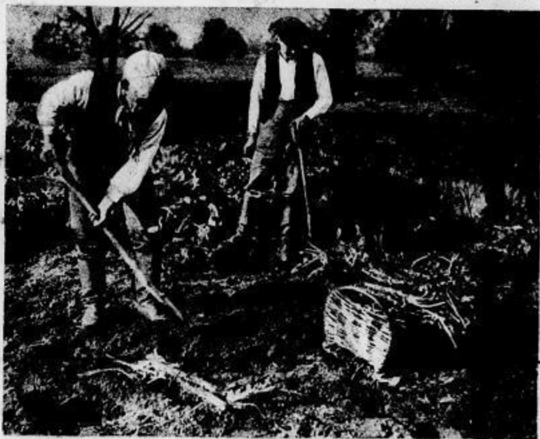
Für Meerrettich, der im Spreewald in großen Mengen gezogen wird, gibt es einen besonderen Markt im Spreewaldort Lübbenau. — Beim Ausgraben der Meerrettichstangen