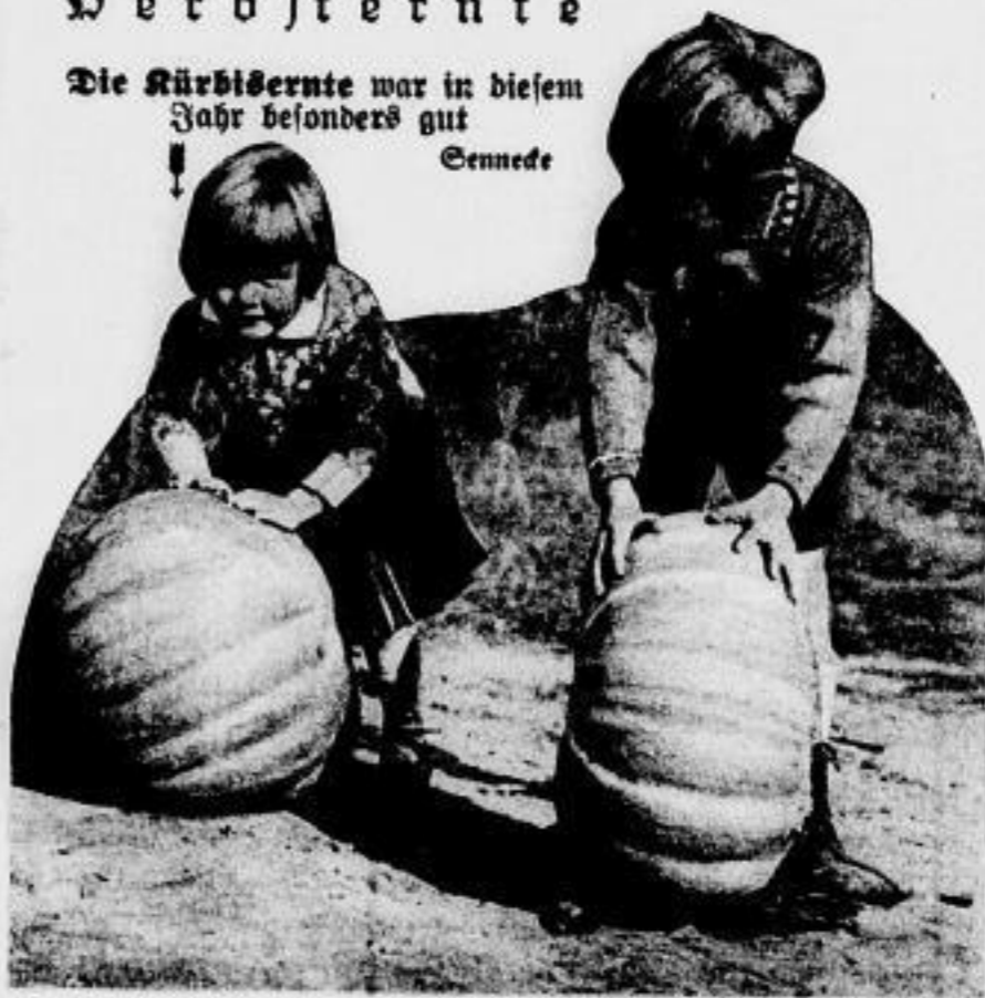
Die Kürbisernte war in diesem Jahr besonders gut Sennede