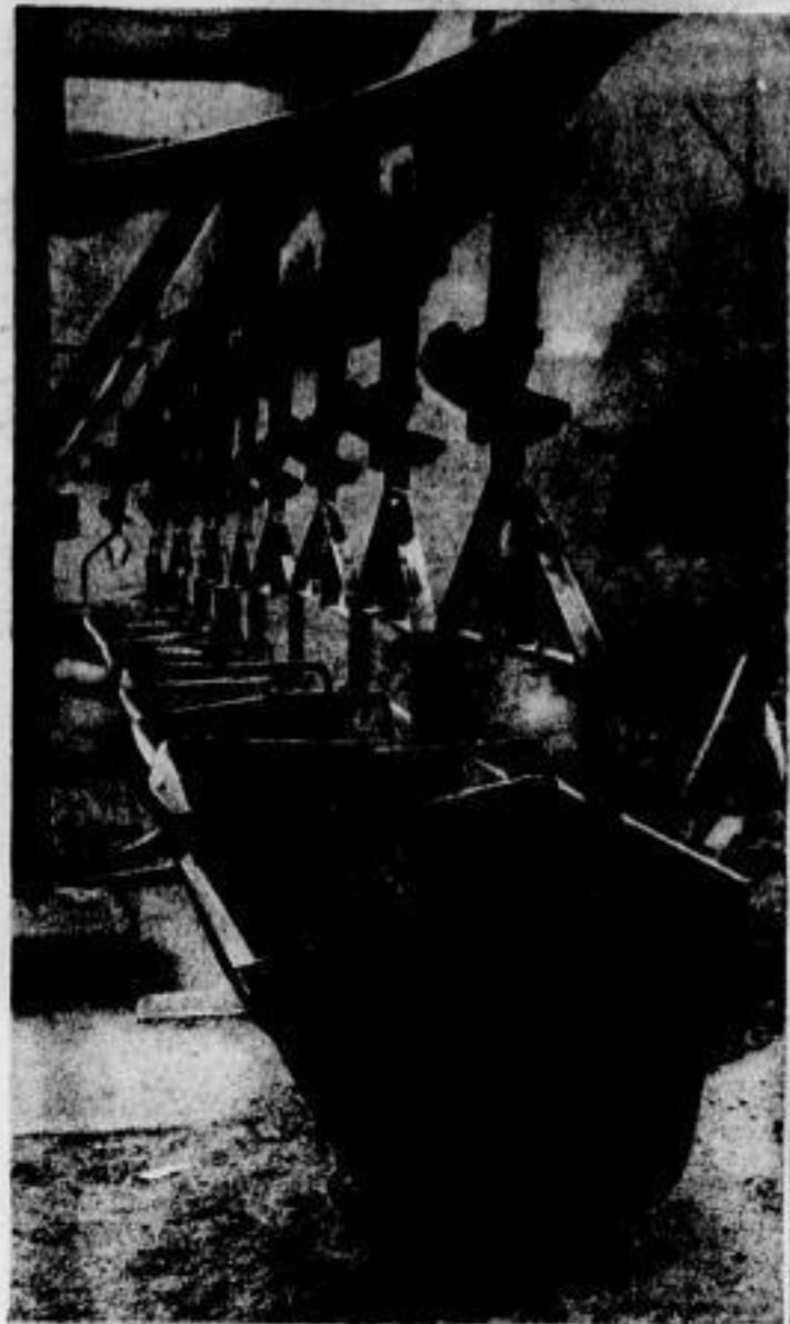
Ripfloren der Hängebahn zum Abtransport des geförderten Kalkes — eine Kette ohne Ende