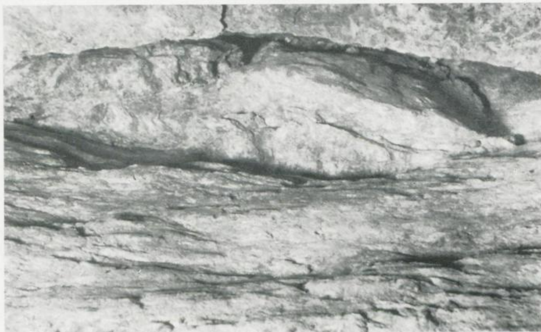
Bild 1. Gangbezirk Kleinvoigtsberg („Alte Hoffnung Gottes“), Peter Sth., 6. Gez. Str. Deutliche horizontale Riefung am liegenden Salband. Der vermutlich als Blattverschiebung gebildete Gang ist völlig verruschelt. M. 1 : 10