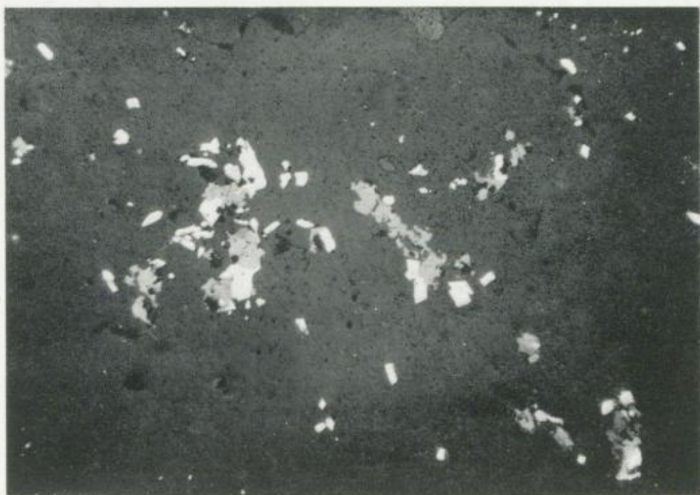
Bild 14. (Schliff Nr. 81) Gangbezirk Reinsberg („Emanuel“), Reinsberger Glück Mg., 4. Gez. Str.

Feinkristalline Zinkblende I, verwachsen mit älterem „Tressenerz“ im Quarz I (= eq-Typ). Vergr. 48 : 1