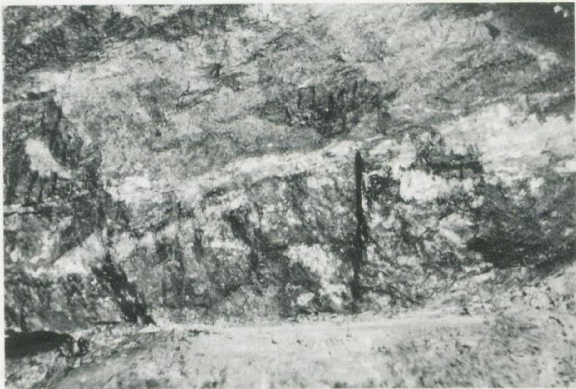
Bild 63. Gangbezirk Kleinvoigtsberg („Alte Hoffnung Gottes“), Beständigkeit Mg., \frac{1}{2} 3. Gez. Str. Typische kompakt-massige kb-Mineralisation, randlich wenig Karbonate der eb-Formation. M. 1 : 5