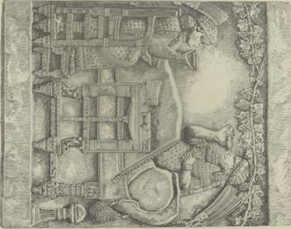
3. Festgelage des Königs Assurbanipal aus Kujundschik. 650 v. Chr. London, Brit. Museum.