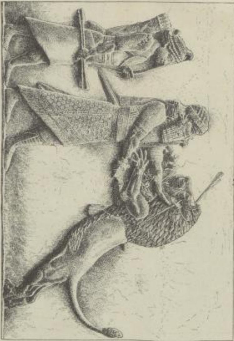
4. Assurbanipal einen Löwen tödend. Von einem Malbasterrelief aus Kujundschik. 650 v. Chr. London, Brit. Museum.