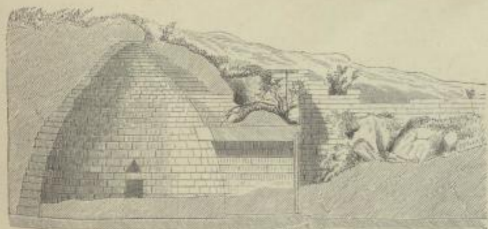
1. Schatzhaus des Atreus zu Mykenae. Durchschnitt. (Reber.)