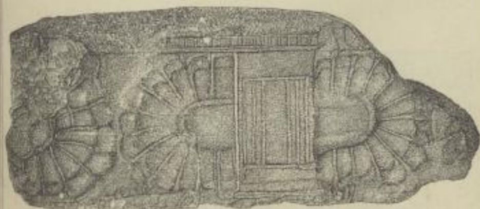
5. Pfeilerfragment aus Porphyr. Mykenae.