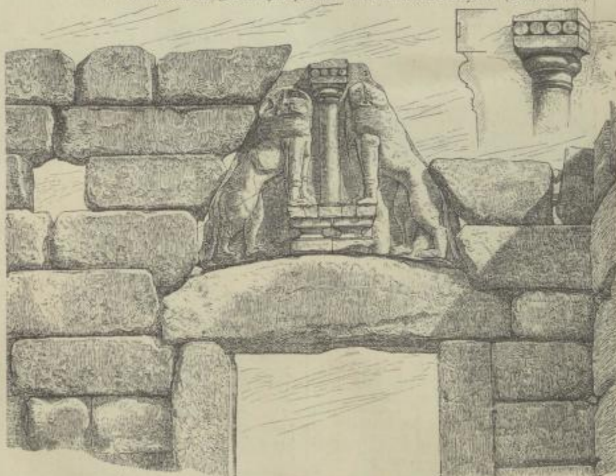
6. Löwenthor zu Mykenae. (Durm.)