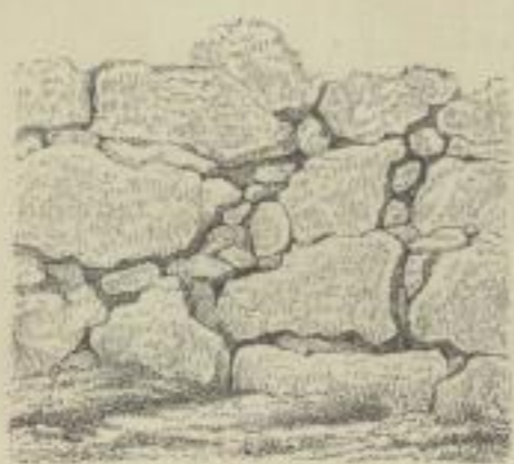
4. Cyklopisches Mauerwerk.