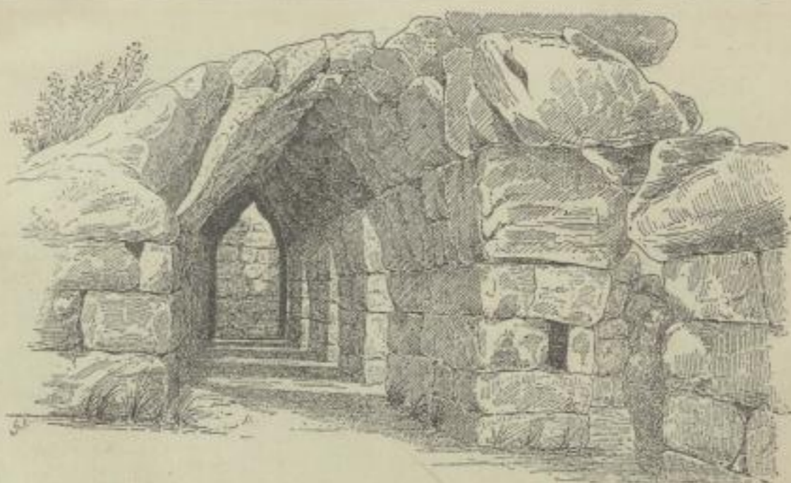
2. Gedeckter Gang aus cyklopischem Mauerwerk in Tiryns. (Schliemann.)