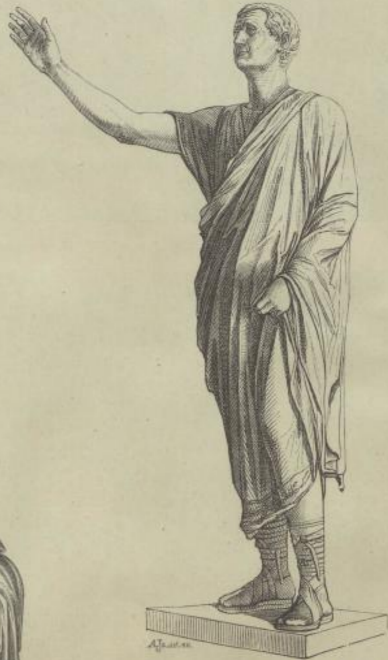
5. Der Redner. Florenz, Etr. Museum.