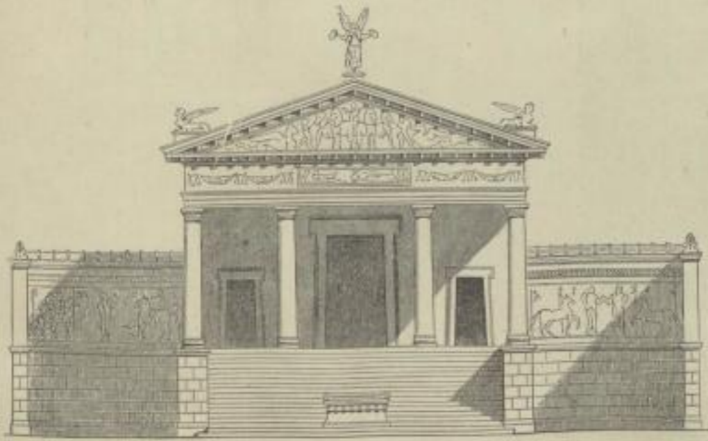
3. Etruskischer Tempel Restauration von Semper.