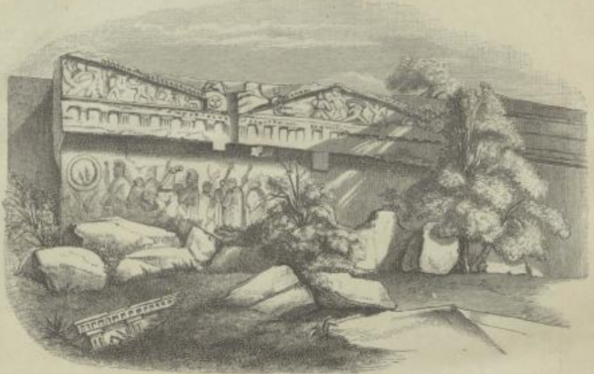
2. Grabfassade zu Norchia.