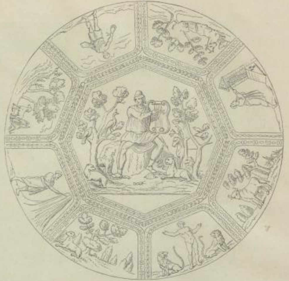
2. Deckenmalerei aus den Katakomben der Domitilla. Im Mittelbilde Orpheus, in vier Aussenbildern Daniel unter den Löwen, Moses vor dem Felsen, David mit der Schleuder und die Erweckung des Lazarus.