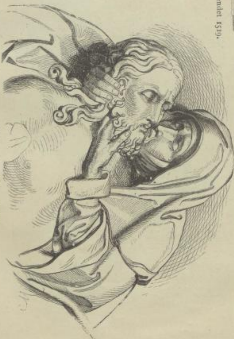
5. Pietä. Von Adam Krafft. Aus der Kreuzabnahme vor dem Theißgärtnerthore in Nürnberg.