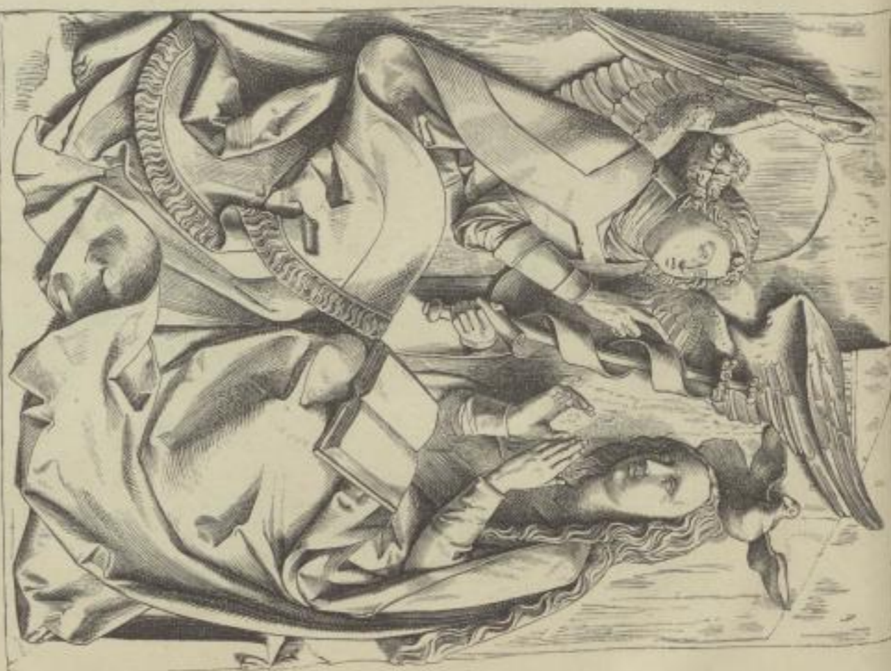
4. Die Verkündigung. Von Veit Stoss, Sammlung Culemann in Hannover.