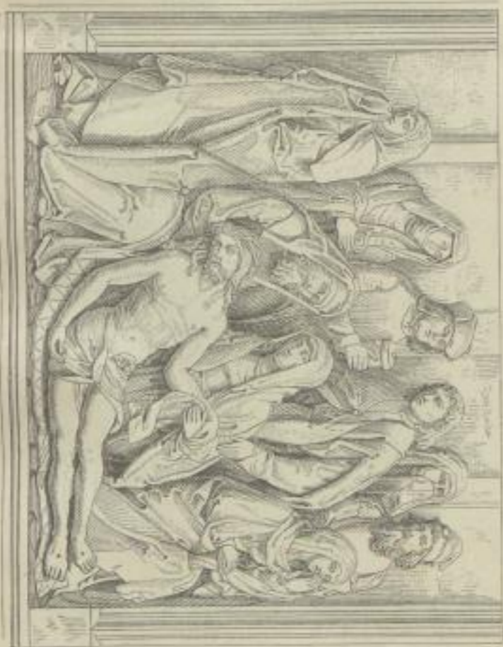
3. Relief in der Kirche zu Maßbrunn bei Würzburg. Von Tilman Riemenschneider (geb. um 1460 in Osterode, † 1531 in Würzburg).