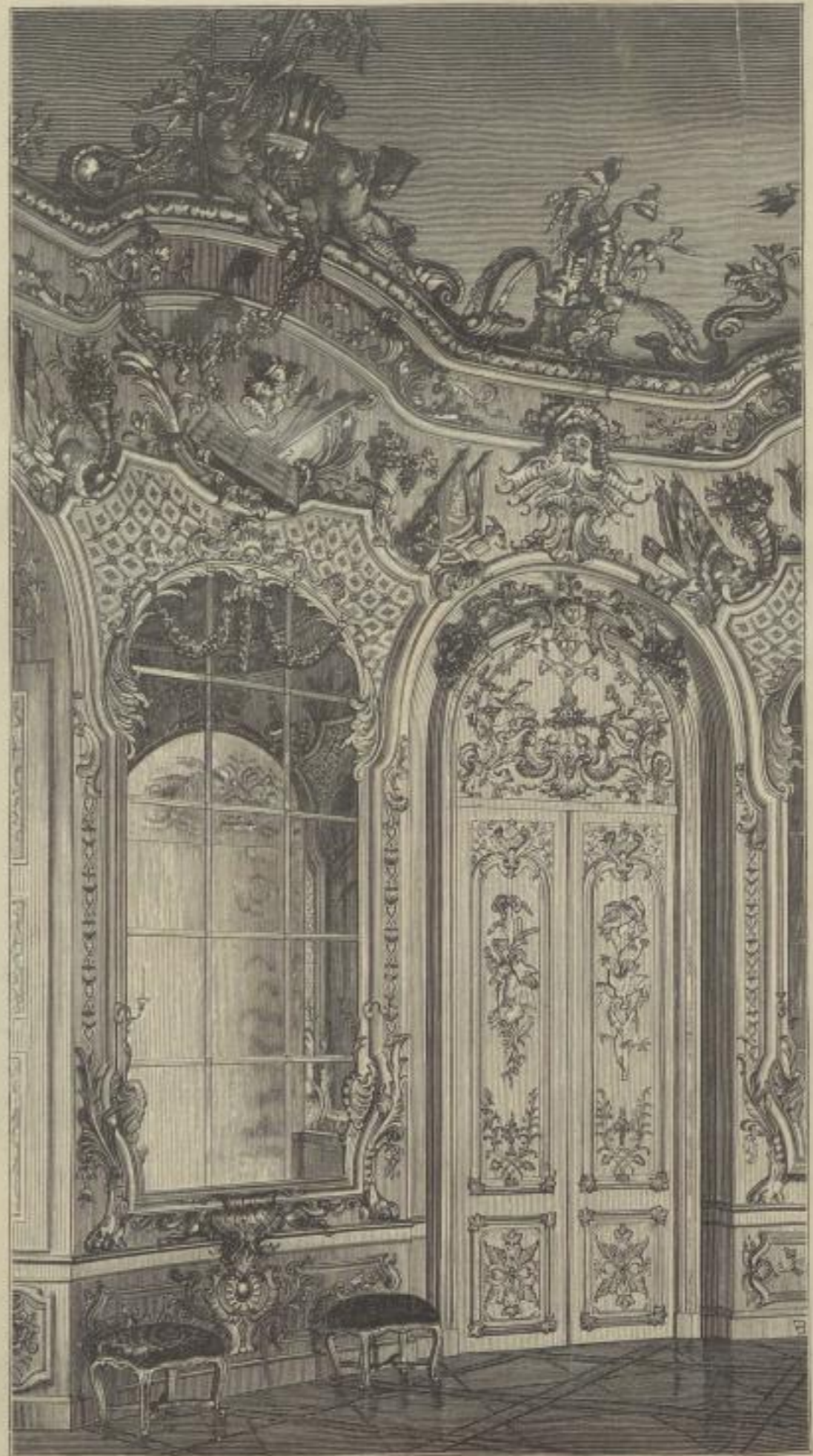
3. Aus der Amalienburg im Nymphenburger Park. Erbaut von Cuviliés.