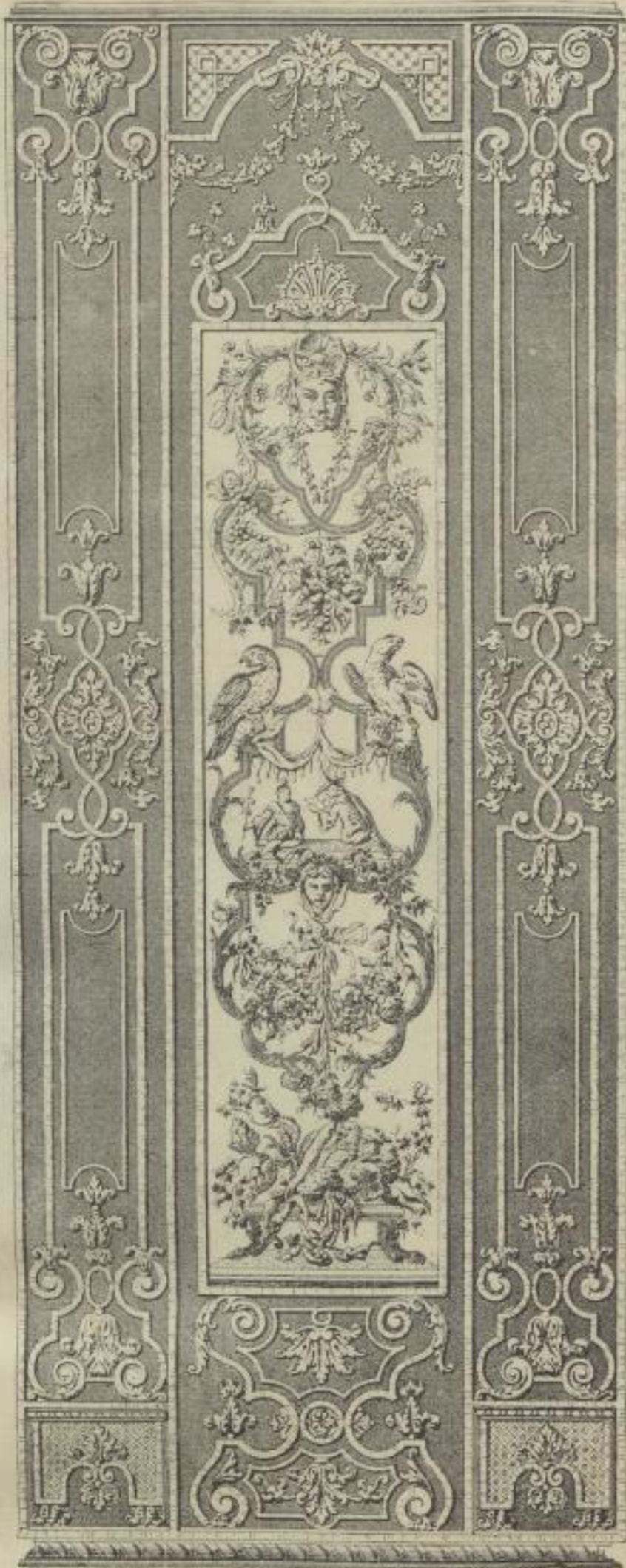
1. Aus dem Schleissheimer Schlosse.