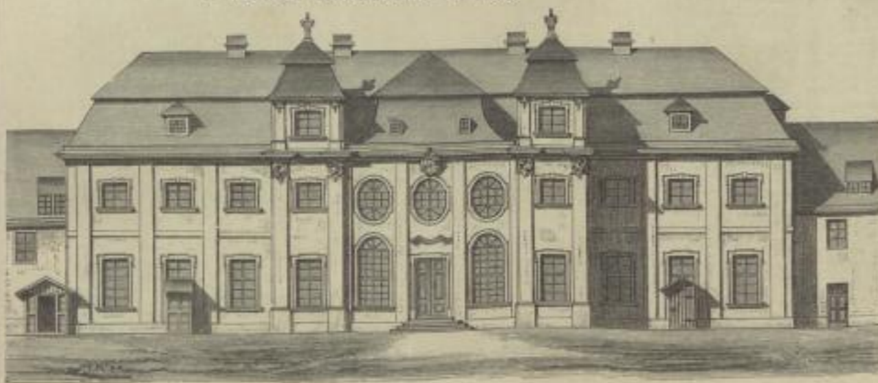
2. Bischöfliches Landhaus bei Breslau.