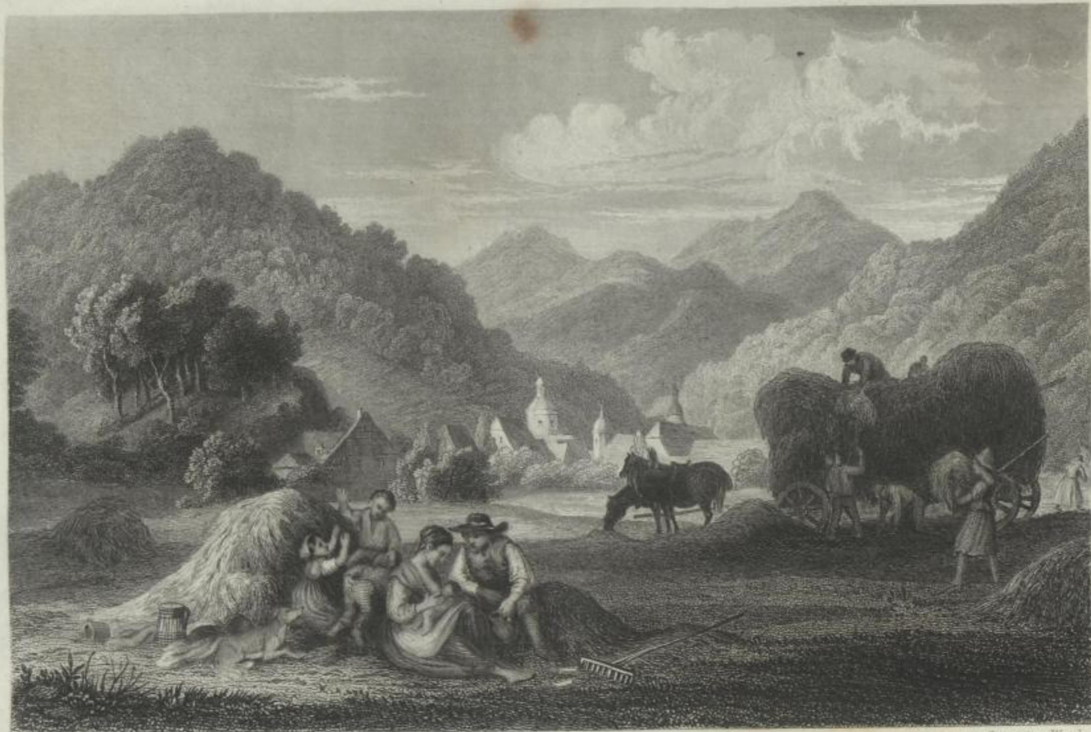
Ges. von L. Richter.