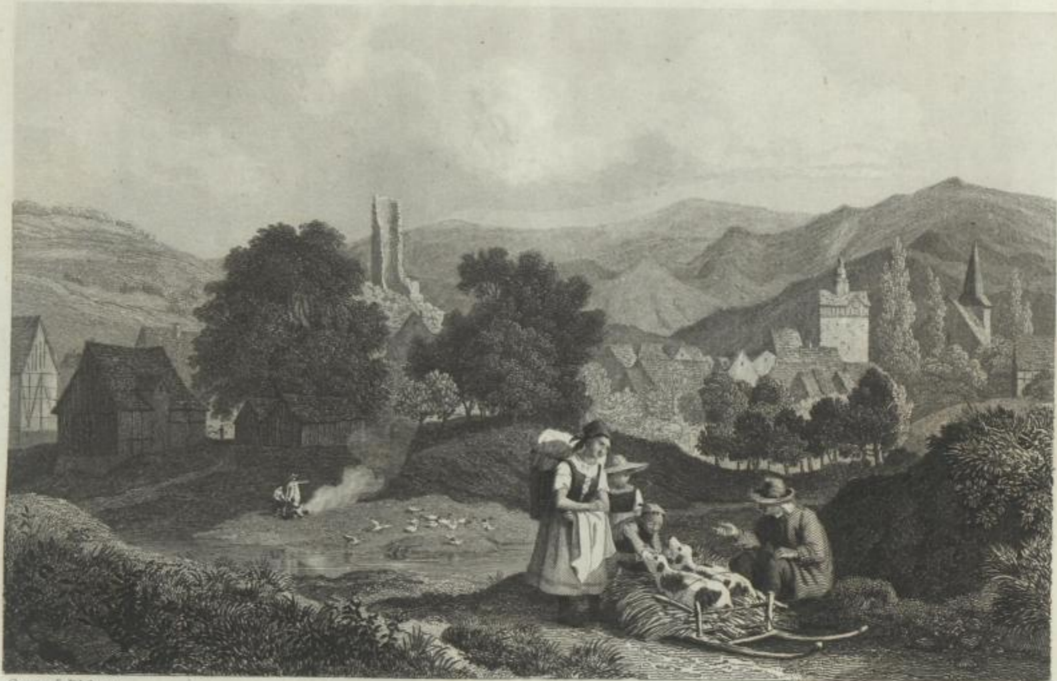
Gez. v. I. Richter.

berz atem den den herer auct inen den. an, berz mit hige Die bal eren eine ls- uns noch ams ein- ten, bat die rif. lla- och un- un- in- ich- des gas berg