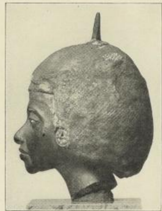
6. Hölzerner Porträtkopf der Königin Teje. (Borchardt.) NR, I.