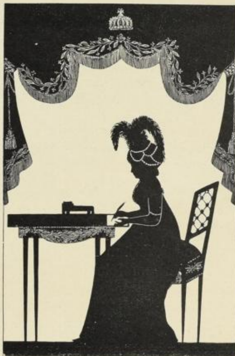
Königin Luise am Schreibtisch

Die entzückend ausgestatteten und verschwenderisch mit farbigen Abbildungen geschmückten Bändchen der „Mode“ enthalten eine allerliebste Kultur-, Kostüm- und Kunstgeschichte vergangener Jahrhunderte, nicht wissenschaftlich erschöpfend, aber wertvoll, anmutig und lebendig. Der temperamentvolle, amüsante Text und die feingewählten Illustrationen geben ein lebenswarmes Bild jener Zeiten, ihrer Menschen und ihrer Moden.