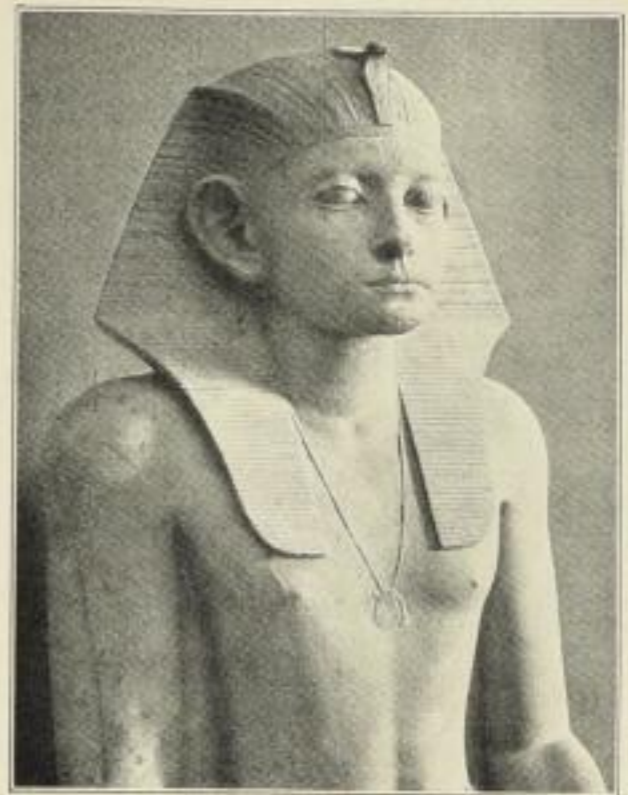
3. Von einer Kalksteinstatue Amenemhät's III. (v. Bissing-Bruckmann.) MR.