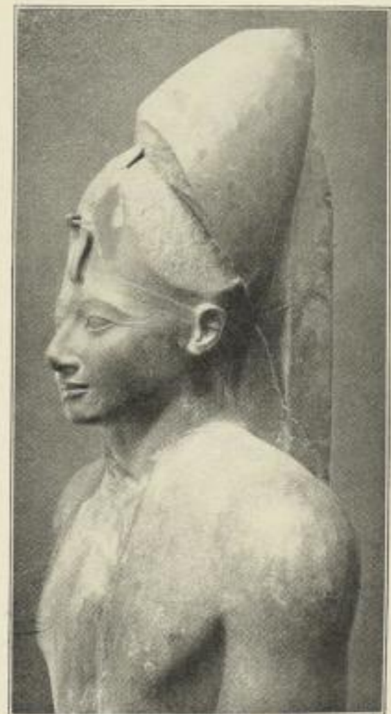
9. Von einer Statue Thutmosis' III. (Borchardt.) NR, I.