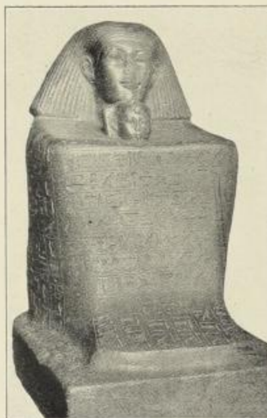
8. Statue des Senmut, hockend. NR, I.