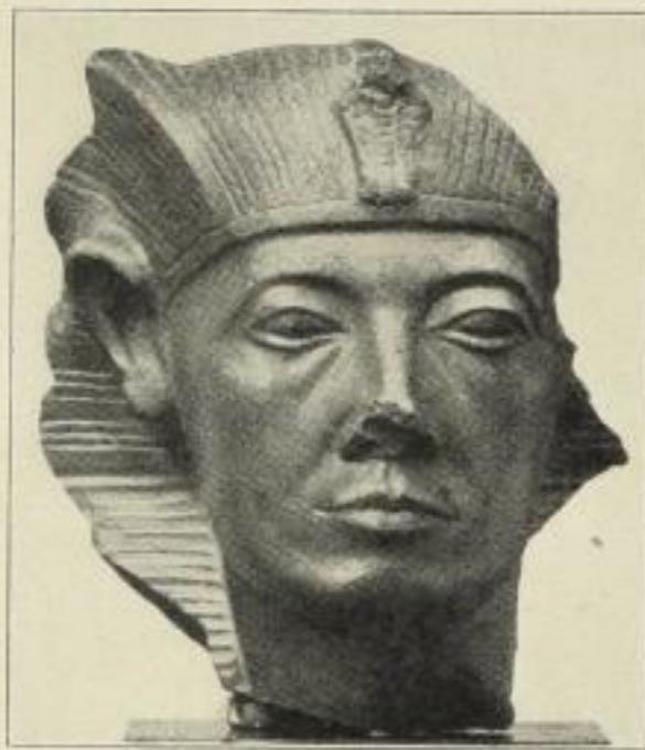
2. Königskopf. MR.