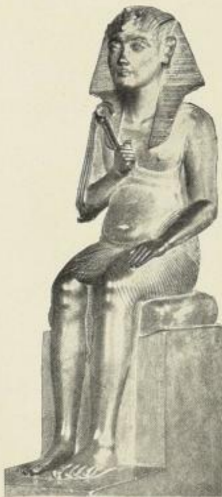
7. Statue König Amenophis' IV. NR, I.