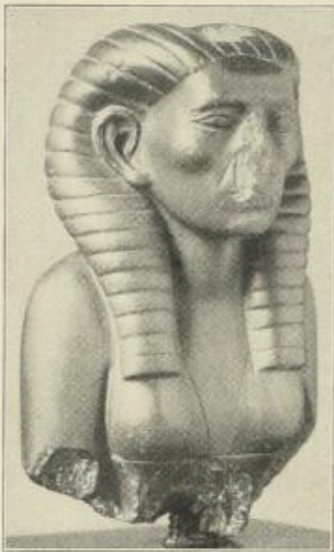
1. Porträtkopf einer Königin. MR.