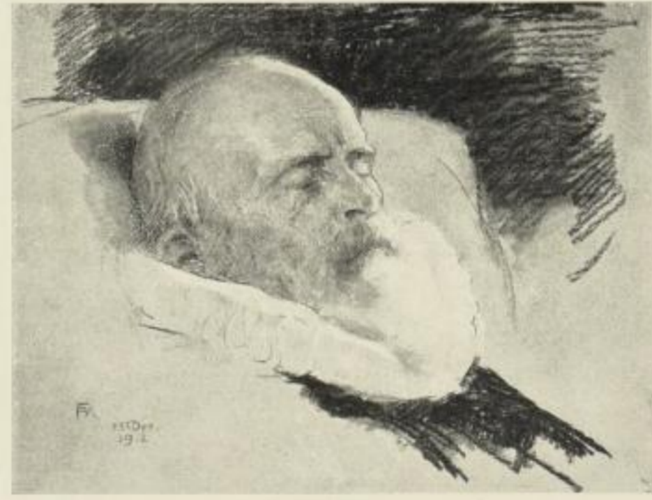
Ⓜ F. A. v. Kaulbach PRINZREGENT LUITPOLD VON BAYERN auf dem Totenbett † 12. XII. 12. †

Die beiden Originalzeichnungen Kaulbachs, die den toten Regenten in der einfachen Joppe und in der Ordenstracht aufgebahrt zeigen, sind in Faksimile-Reproduktionen in folgenden Formaten erschienen: