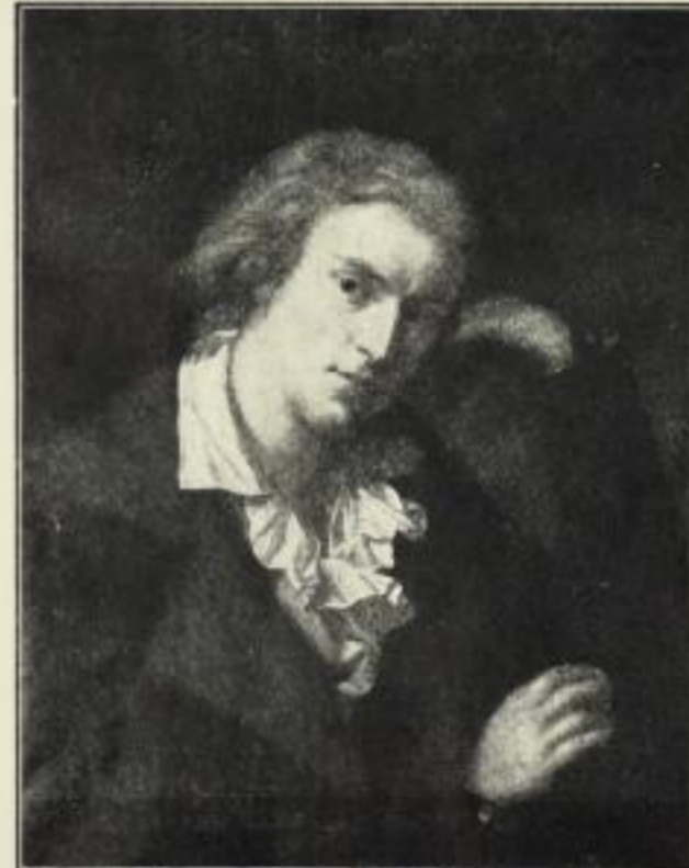
Anton Graff: Schiller.

Bildgröße: 74x94 cm. M. 50.- Auf Kupferdruckkarton: 100x120 cm.