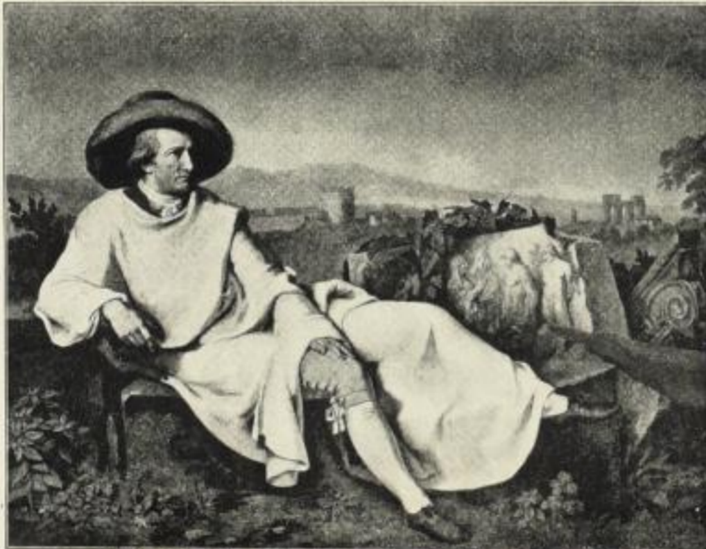
J. H. W. Tischbein: Goethe in Italien.

Wir empfehlen nachstehende, im Buchhandel stets gefragten Blätter: