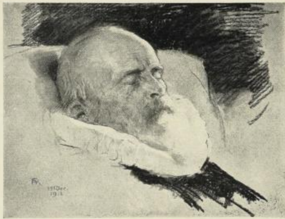
F. A. v. Kaulbach PRINZREGENT LUITPOLD VON BAYERN auf dem Totenbett † 12. XII. 12. †

Die beiden Originalzeichnungen Kaulbachs, die den toten Regenten in der einfachen Joppe und in der Ordenstracht aufgebahrt zeigen, sind in Faksimile-Reproduktionen in folgenden Formaten erschienen: