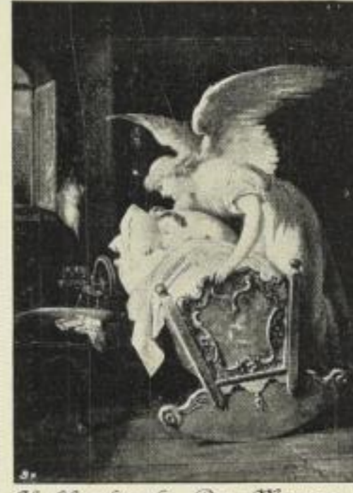
H. Kaulbach: Der Morgen. Photogravüre auf Kupferdruckkarton. Bildgr. . . 38×51 cm. Jetzt 6 Mk. ord. Kartongr. 73×95 cm. Bildgr. . . 22×30 cm. Jetzt 250 Mk. ord. Kartongr. 44×55 cm.