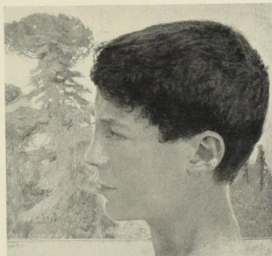
Greiner, Römischer Knabenkopf (verkleinert)