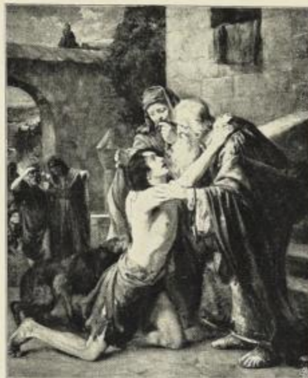
F. Genutat: Der verlorene Sohn.

Bildgröße . . 19×20 cm. jetzt 250 Mk. ord. Kartongröße 44×55 cm.