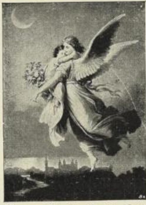
W. von Kaulbach: Zu Gott. Photogravüre auf Kupferdruckkarton. Bildgr. . . 38×52 cm. Jetzt 6 Mk. ord. Kartongr. 73×95 cm. Bildgr. . . 22×30 cm. Jetzt 250 Mk. ord. Kartongr. 44×55 cm.