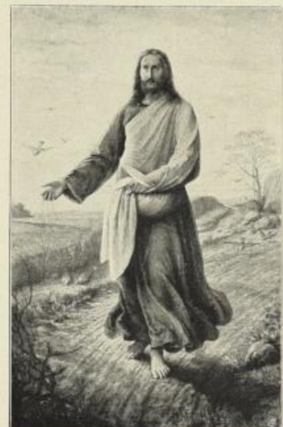
C. Schönherr: Christus der Säemann.

Bildgröße . . . 42×57 cm. jetzt 6 Mk. ord. Kartongröße 73×95 cm. Bildgröße . . . 23×32 cm. jetzt 250 Mk. ord. Kartongröße 44×55 cm.