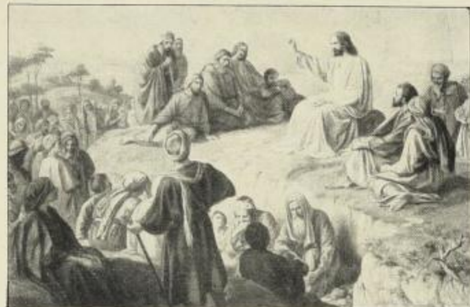
Ph. Schumacher: Die Bergpredigt Christi.

Bildgröße . . 61×40 cm. jetzt 6 Mk. ord. Kartongröße 95×73 cm. Bildgröße . . 33×21 cm. jetzt 250 Mk. ord. Kartongröße 55×44 cm.