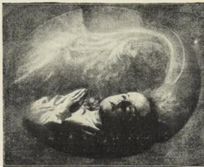
J. Kostka: Guten Abend, gute Nacht, von Englein bewacht — Photogravüre auf Kupferdruckkarton.

Bildgröße . . 32×26 cm. Jetzt 250 Mk. ord. Kartongröße 55×44 cm.