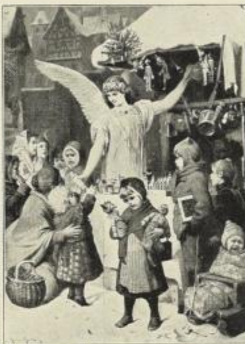
H. Kaulbach: Weihnachtsengel. Photogravüre auf Kupferdruckkarton. Bildgr. . . 22×30 cm. Jetzt 250 Mk. ord. Kartongr. 44×55 cm.