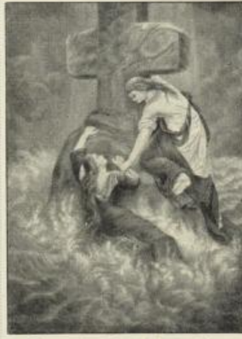
Oertel: Barmherzigkeit. Photogravüre auf Kupferdruckkarton. Bildgr. . . 25×35 cm. Jetzt 250 Mk. ord. Kartongr. 44×55 cm.

☛ Sämtliche Bilder sind auch handkoloriert ☛ zum doppelten Preis erhältlich, sowie ☛ auch im Kabinettformat à 1 Mark ord.