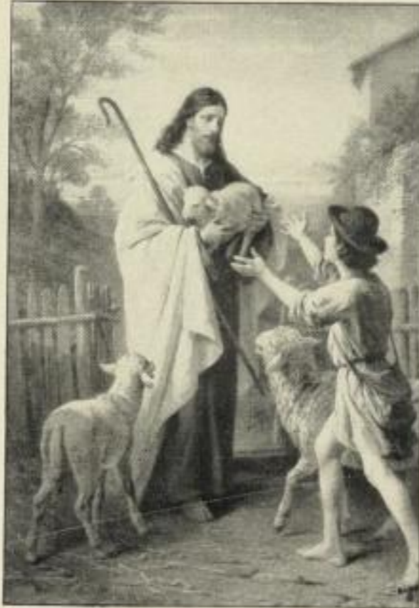
B. Plockhorst: Freuet euch mit mir.

Bildgröße . . . 38×55 cm. jetzt 6 Mk. ord. Kartongröße 73×95 cm. Bildgröße . . . 22×32 cm. jetzt 250 Mk. ord. Kartongröße 44×55 cm.