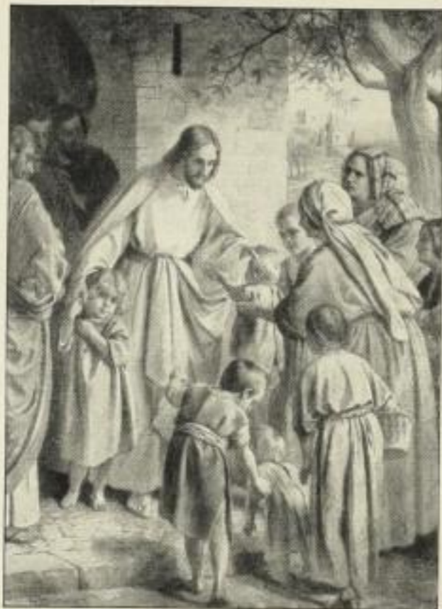
Ph. Schumacher: „Lasset die Kindlein zu mir kommen!“

Wir erwarben von dem Kunstverlage Carl Brack & Keller, Berlin: