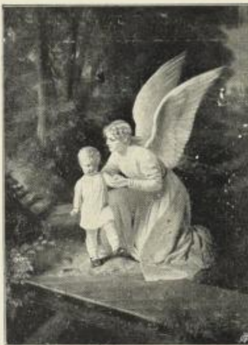
H. Kaulbach: Schutzengel. Photogravüre auf Kupferdruckkarton. Bildgr. . . 38×52 cm. Jetzt 6 Mk. ord. Kartongr. 73×95 cm. Bildgr. . . 22×30 cm. Jetzt 250 Mk. ord. Kartongr. 44×55 cm.