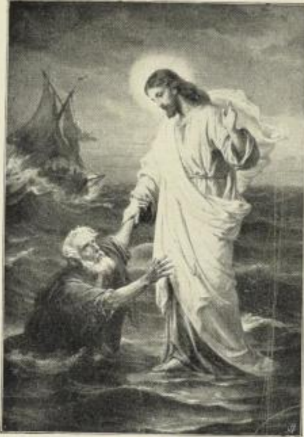
B. Plockhorst: Herr, hilf mir.

Wir erwerben von Carl Brack & Keller, Berlin: dem Kunstverlage