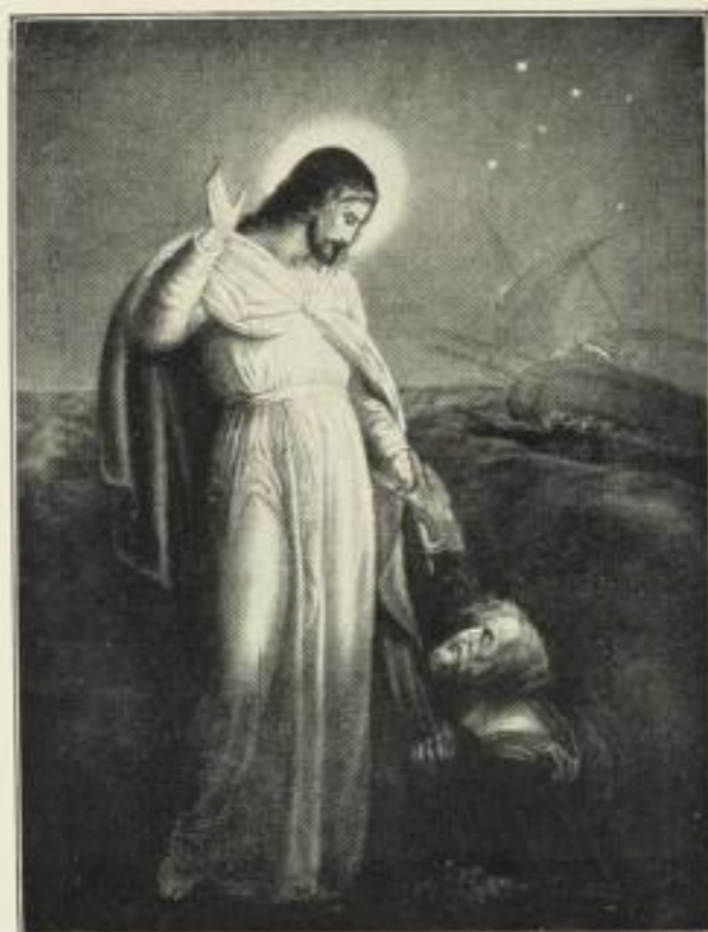
Richter: „Herr, hilf mir!“

Bildgröße: 35 x 46 cm, jetzt 5 Mk. ord. Kartongröße 60 x 80 cm.