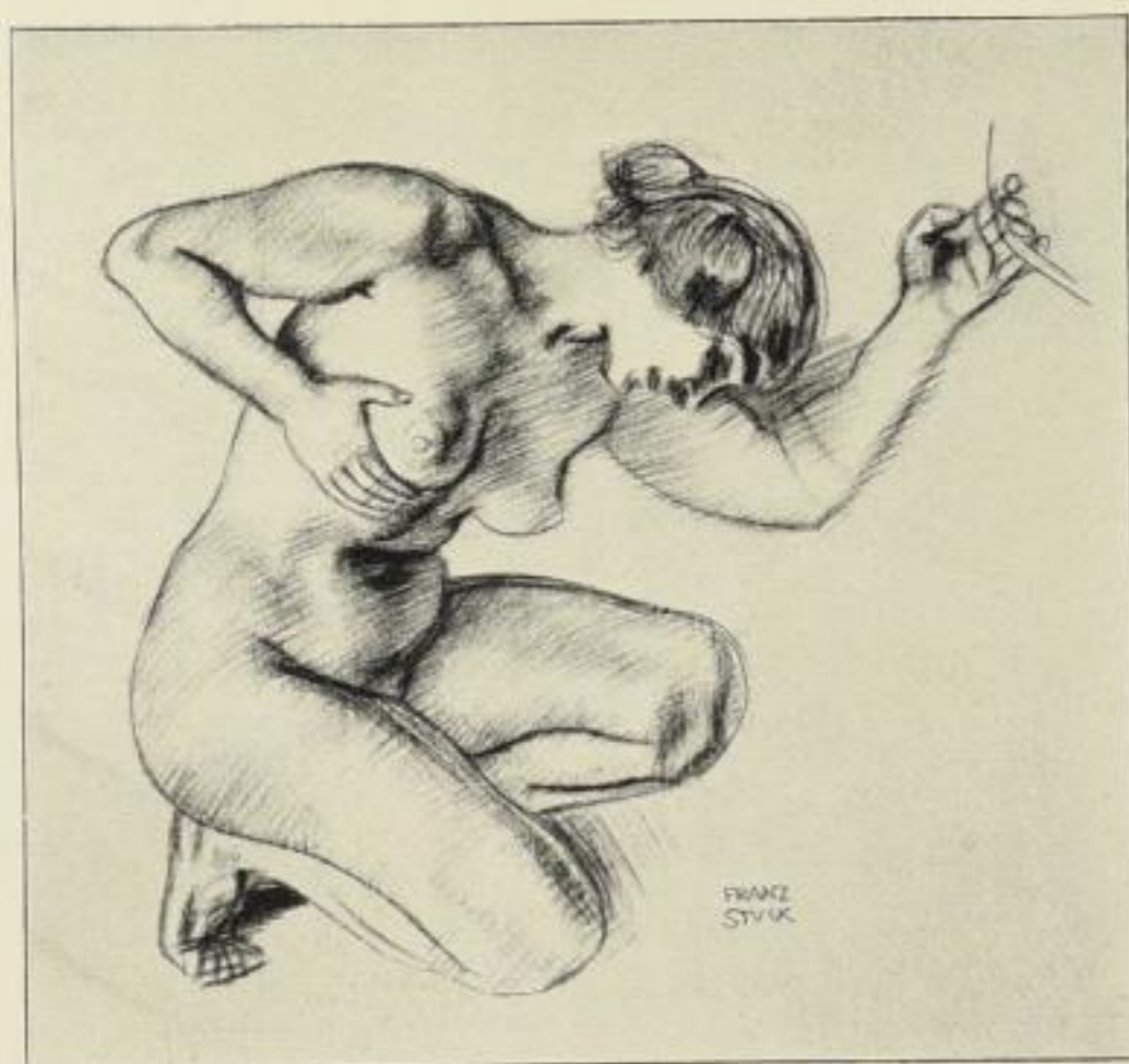
Stuck, Sterbende Amazone (verkleinert)