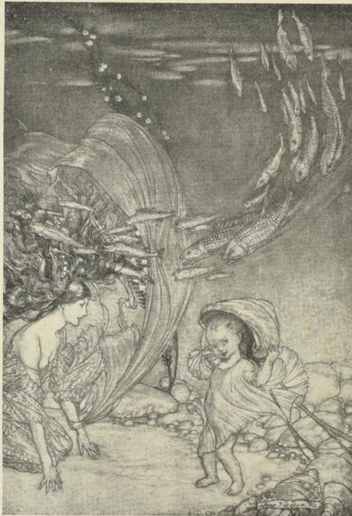
(Verkleinerte Wiedergabe; Original vielfarbig)

Einmalige, numerierte Vorzugs-Ausgabe in hundert Exemplaren. Preis in echt Pergament gebunden M. 18.— ord., M. 12.— bar