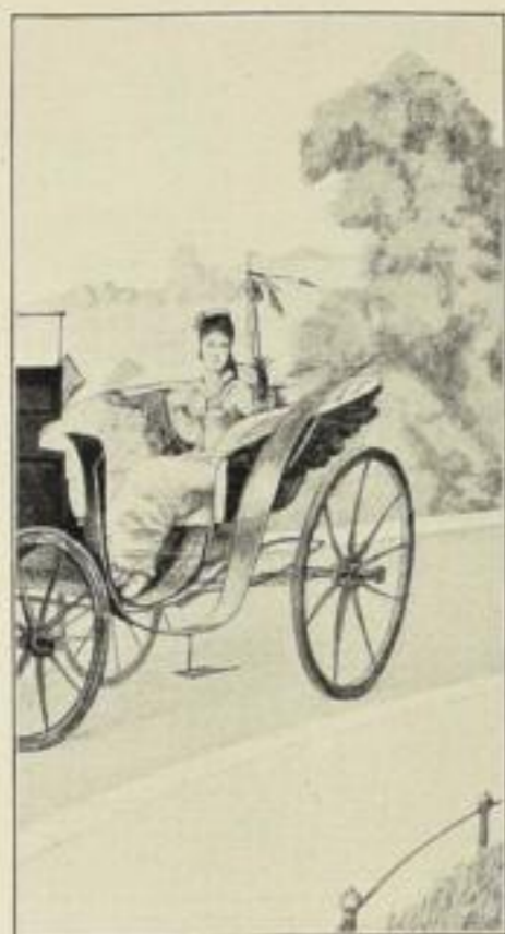
Klinger, Im Bois de la Cambre (sehr stark verkleinert)

Die Bände stehen auf Wunsch auch à cond. zu Diensten und ersuchen wir, zu verlangen.