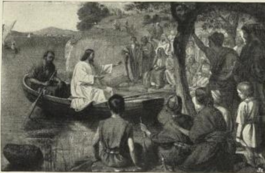
Ph. Schumacher: Christi Predigt am See.

Wir erwarben von dem Kunstverlage Carl Brack & Keller, Berlin: