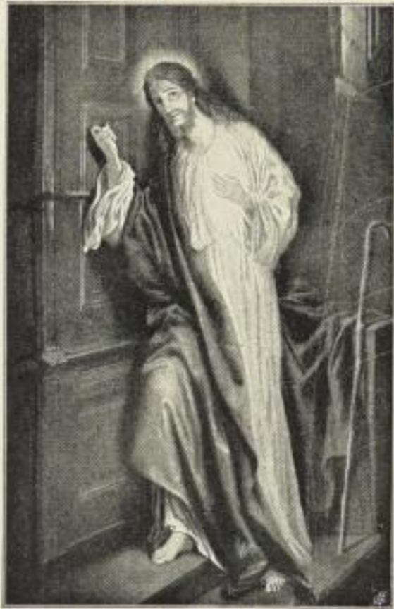
J. Kostka: Siehe, ich stehe vor der Tür und klopfe an.

Bildgröße . . . 37×57 cm. jetzt 6 Mk. ord. Kartongröße 73×95 cm. Bildgröße . . . 21×31 cm. jetzt 250 Mk. ord. Kartongröße 44×55 cm.