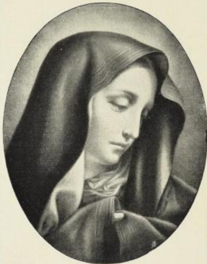
Carlo Dolci: Mater dolorosa.

Bildgröße . . . 21×30 cm. jetzt 250 Mk. ord. Kartongröße 44×55 cm.