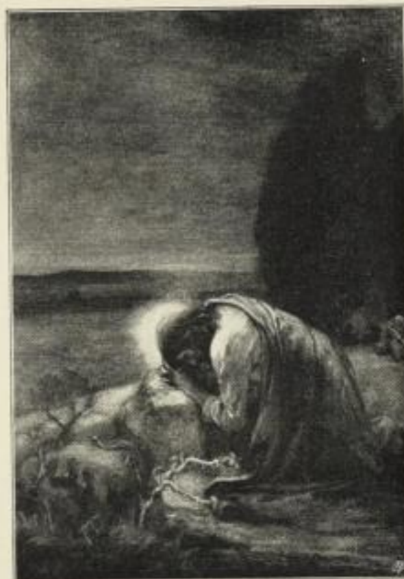
H. Eickmann: Gethsemane.

Sämtliche Bilder sind auch handkoloriert zum doppelten Preis erhältlich.