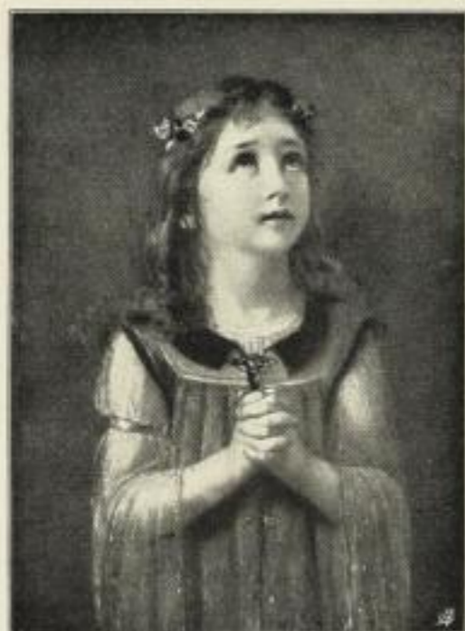
Ch. S. Philippe: Glaube.

Wir erwarben von Carl Brack & Keller, Berlin: dem Kunstverlage