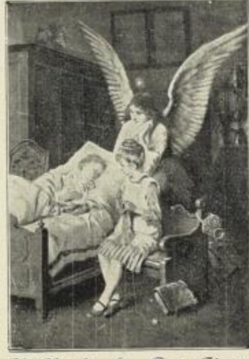
H. Kaulbach: Der Abend. Photogravüre auf Kupferdruckkarton. Bildgr. . . 38×51 cm. Jetzt 6 Mk. ord. Kartongr. 73×95 cm. Bildgr. . . 22×30 cm. Jetzt 250 Mk. ord. Kartongr. 44×55 cm.