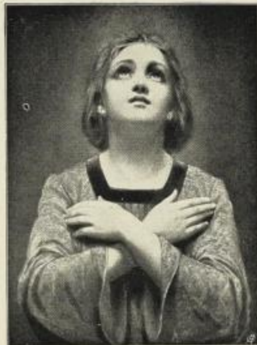
Ch. S. Philippe: Hoffnung.

Bildgröße: 35 x 46 cm, jetzt 5 Mk. ord. Kartongröße 60 x 80 cm.