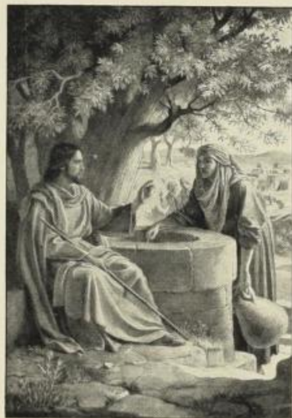
Ph. Schumacher: Christus und die Samariterin.