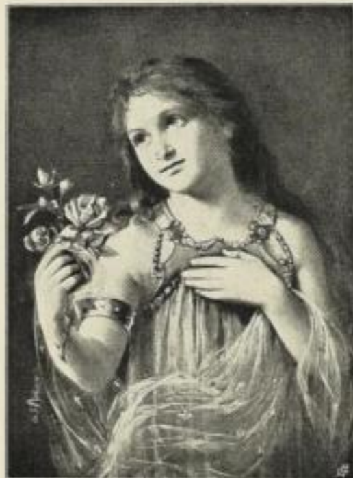
Ch. S. Philippe: Liebe.

Bildgröße: 35 x 46 cm, jetzt 5 Mk. ord. Kartongröße 60 x 80 cm.