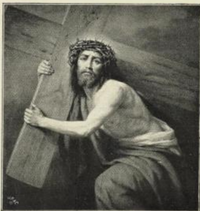
G. Hader: Der göttliche Kreuzträger.

Bildgröße . . . 25×31 cm. jetzt 250 Mk. ord. Kartongröße 44×55 cm.