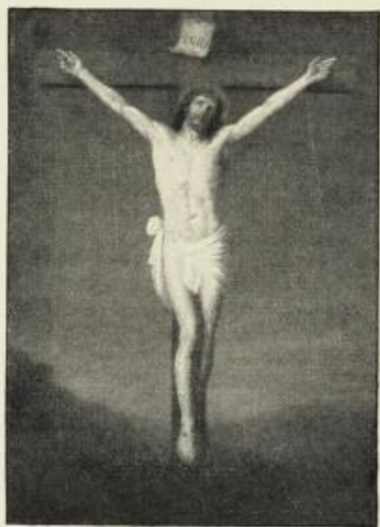
Koch: Christus am Kreuz.

Bildgröße . . 60×40 cm. jetzt 6 Mk. ord. Kartongröße 95×73 cm. Bildgröße . . 33×22 cm. jetzt 250 Mk. ord. Kartongröße 55×44 cm.