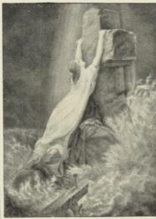
Oertel: Rettungsfelsen. Photogravüre auf Kupferdruckkarton. Bildgr. . . 25×35 cm. Jetzt 250 Mk. ord. Kartongr. 44×55 cm.