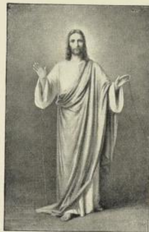
M. v. Stuckradt: Christus segnend.

Bildgröße . . 24×30 cm. jetzt 250 Mk. ord. Kartongröße 44×55 cm.