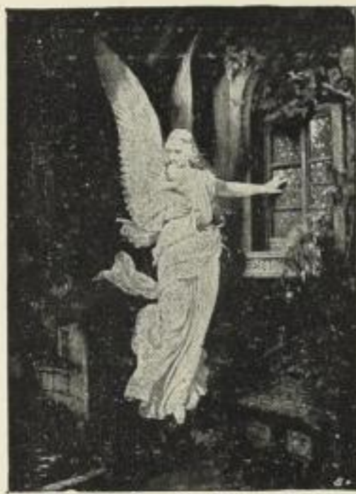
H. Kaulbach: Von Gott. Photogravüre auf Kupferdruckkarton. Bildgr. . . 38×52 cm. Jetzt 6 Mk. ord. Kartongr. 73×95 cm. Bildgr. . . 22×30 cm. Jetzt 250 Mk. ord. Kartongr. 44×55 cm.

Wir erwarben von Carl Brack & Keller, Berlin: dem Kunstverlage