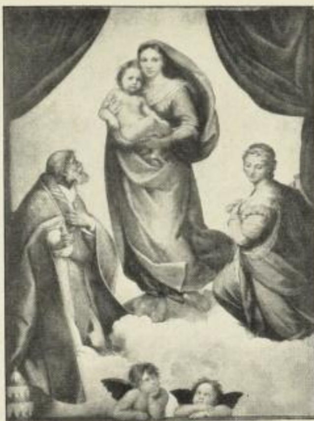
Rafaël: Madonna Sixtina.

Bildgröße: 25 x 31 cm, jetzt 250 Mk. ord. Kartongröße 44 x 55 cm.