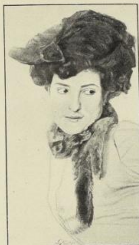
Greiner, Dame mit Hut (sehr stark verkleinert)