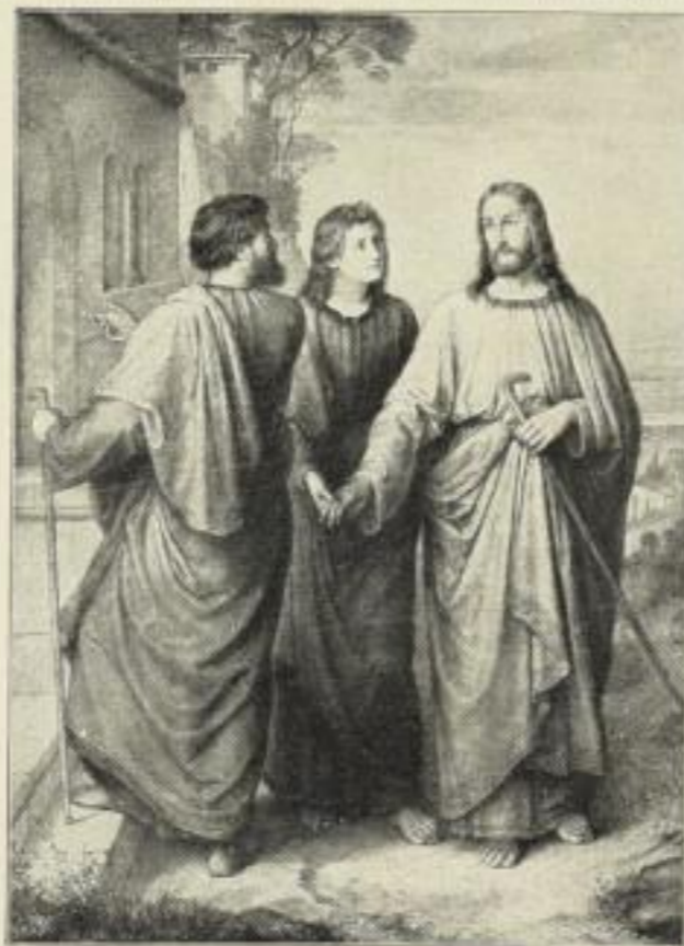
C. Schönherr: Herr, bleibe bei uns.

Bildgröße . . . 30×61 cm. jetzt 6 Mk. ord. Kartongröße 73×95 cm.