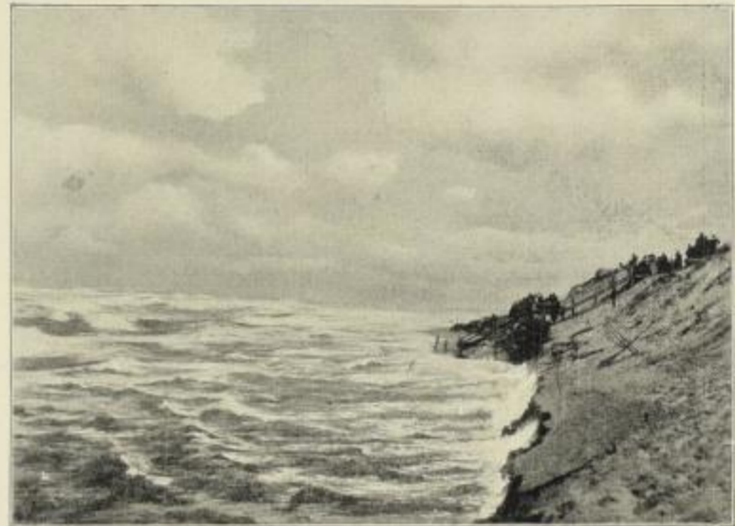
Blatt 2: FLUT