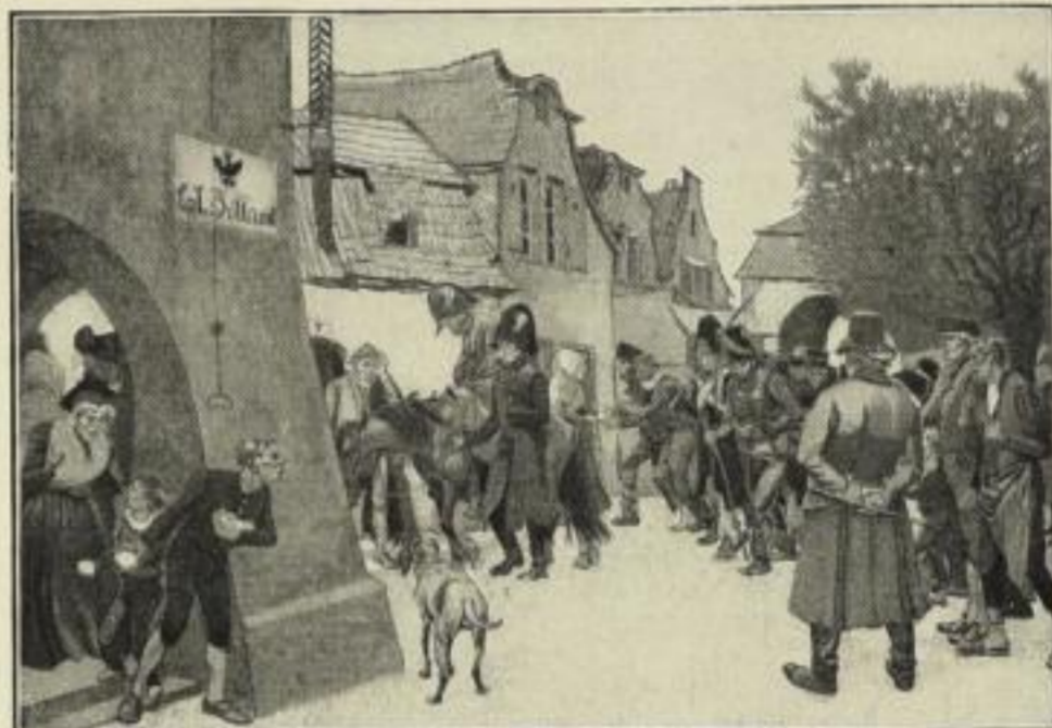
Nr. 176. Georg Lebrecht, Mit Mann und Ross und Wagen, so hat sie Gott geschlagen. ♦ Größe 100 x 70 cm 6 Mark