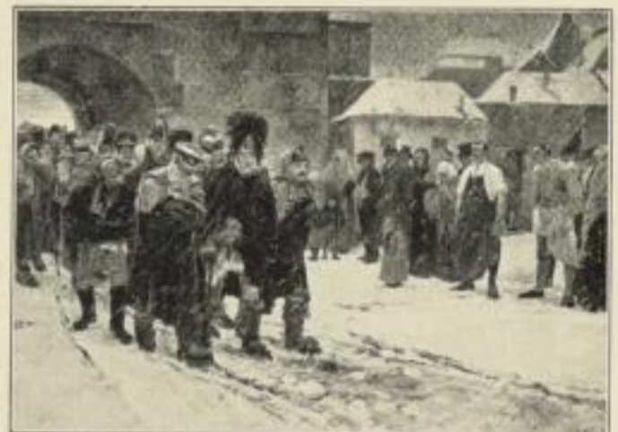
Mit Mann und Ross und Wagen hat sie der Herr geschlagen

4 vornehme Gravure-Postkarten braun und blau zusammen 60 Pfg.