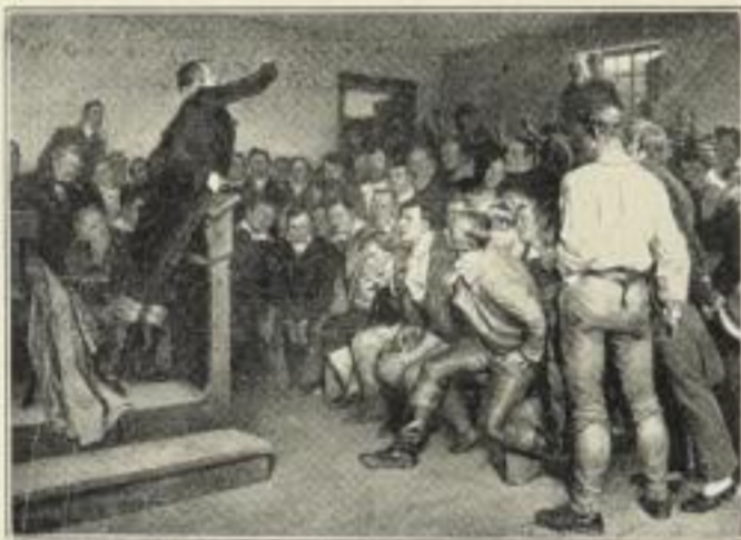
Professor Steffens begeistert in Breslau im Jahre 1813 zur Volkerhebung

Im Jahre 1913 in vielen hunderttausend Exemplaren zu verkaufen.