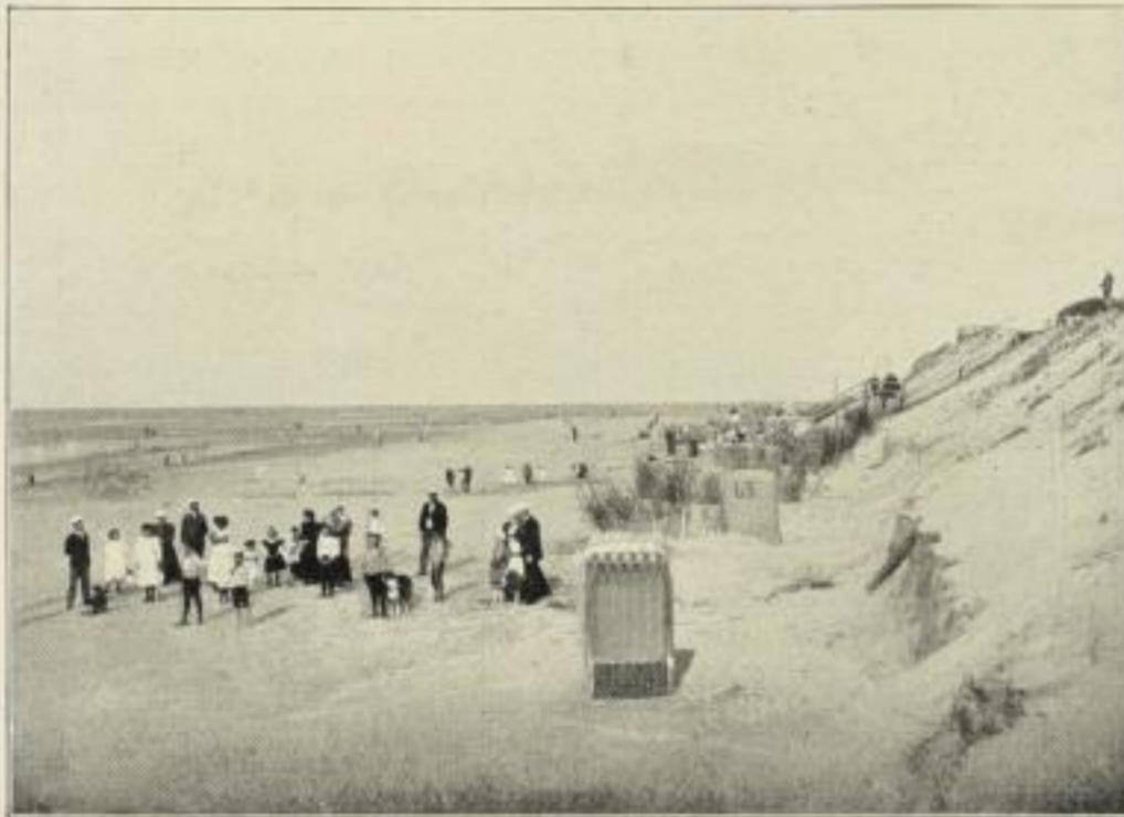
Blatt 1: EBBE