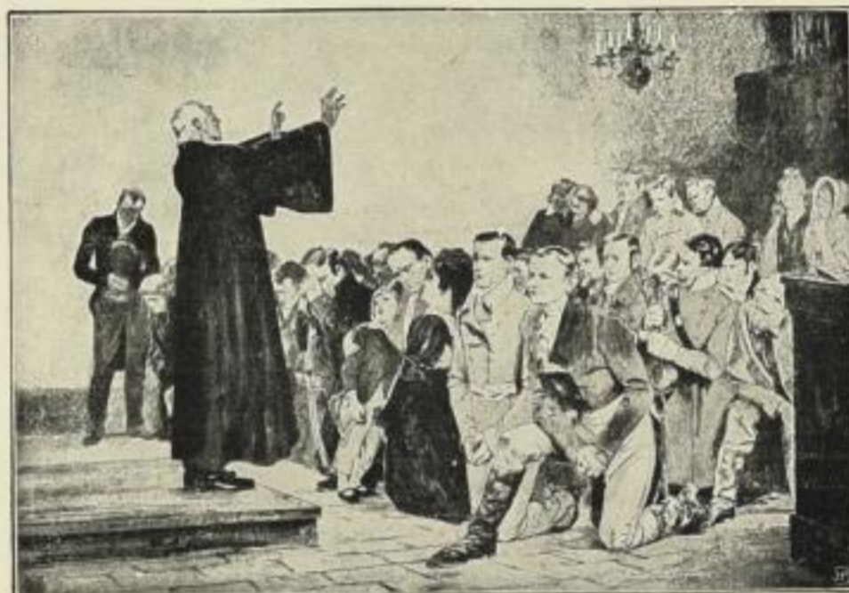
Nr. 113. Arthur Kampf, Einsegnung der Freiwilligen 1813 Größe 100 x 70 cm 6 Mark