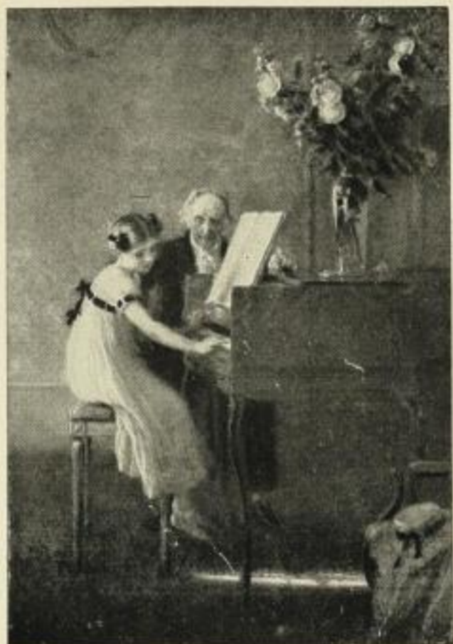
Muenier, Erste Klavierstunde (Meister-Gravüren No. 39)