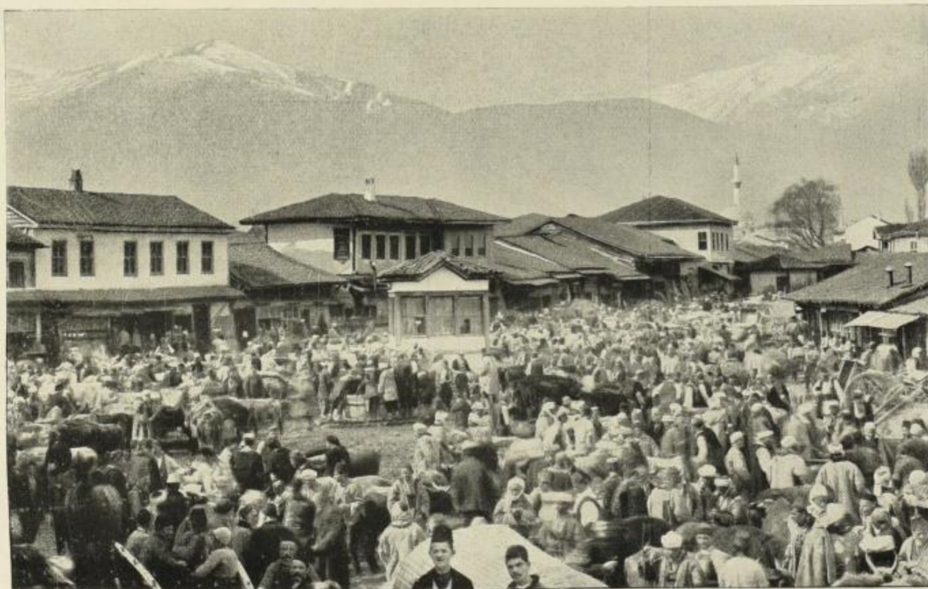
Marktplatz von Monastir. Im Hintergrund der schneebedeckte Peristeri.

M. 3.50 ord., M. 2.50 netto, M. 2.25 netto bar und 11/10. Illustrierte Kundenprospekte gratis.