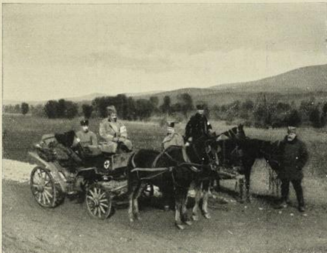
„Unsere Expedition auf dem Wege nach Prilep.“

Das erste Buch über den serbischen Feldzug in Macedonien.