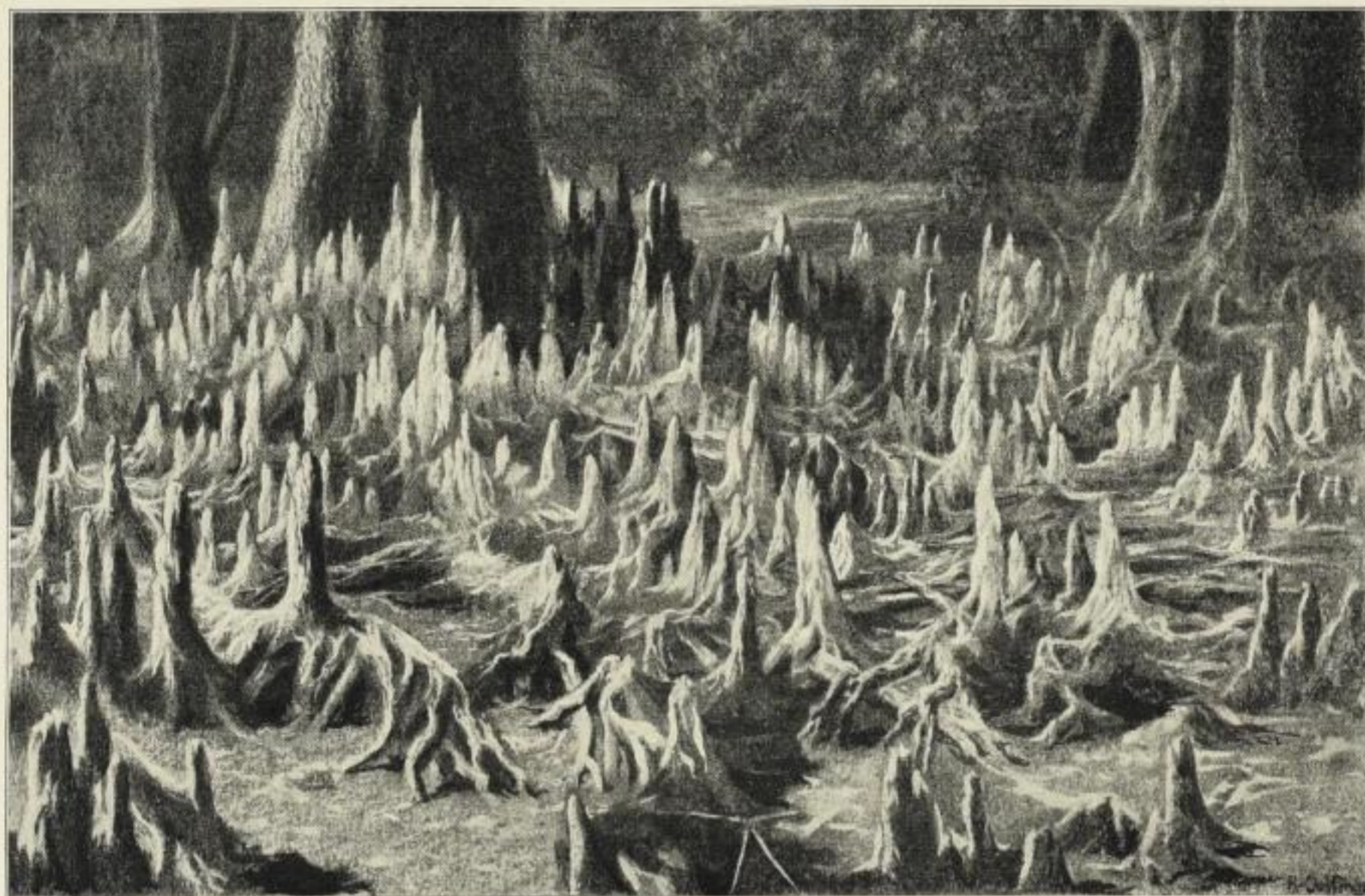
Lufiwurzeln des Mangrovebaumes. (Nach einer Naturaufnahme von J. Schmidt gezeichnet von R. Oeffinger.)