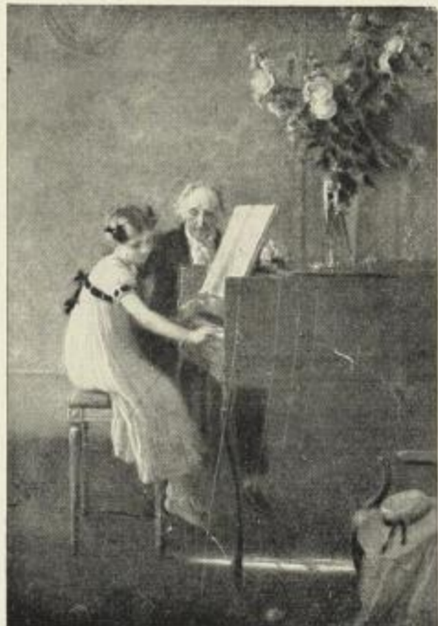
Muenier, Erste Klavierstunde (Meister-Gravüren No. 39)