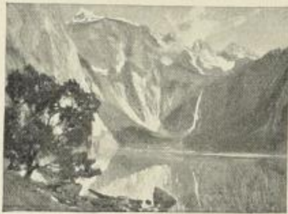
Bildgrösse 17 1 / 2 × 24 1 / 2 cm