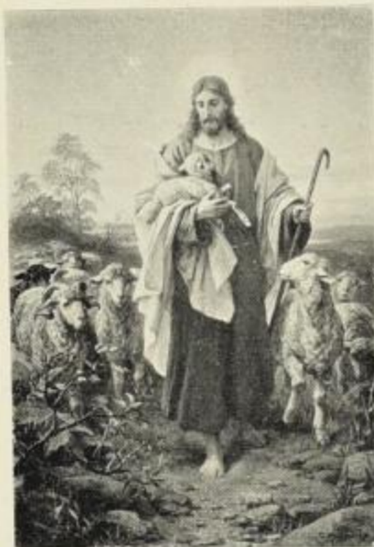
B. Plockhorst Der gute Hirte

Folio-Aquarelldruck M. 5.— ord., M. 3.— no.