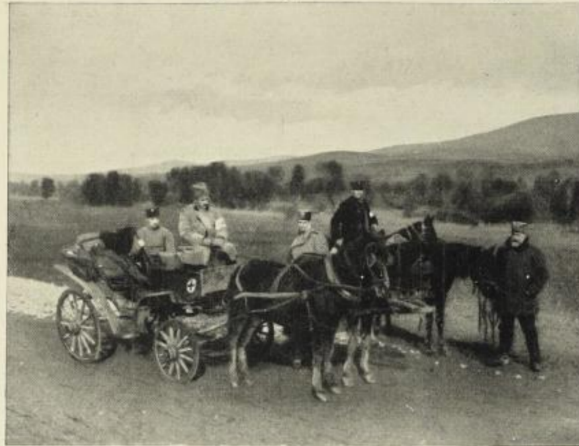
„Unsere Expedition auf dem Wege nach Prilep.“

Das erste Buch über den serbischen Feldzug in Macedonien.