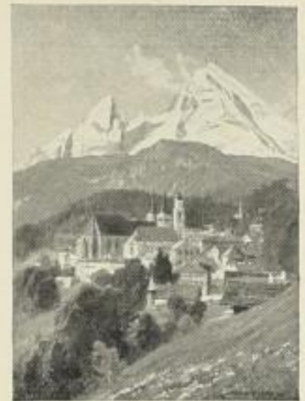
Bildgrösse 17 1 / 2 × 27 cm

(Gegenstück zum früher erschienenen Hochformat St. Bartholomä )