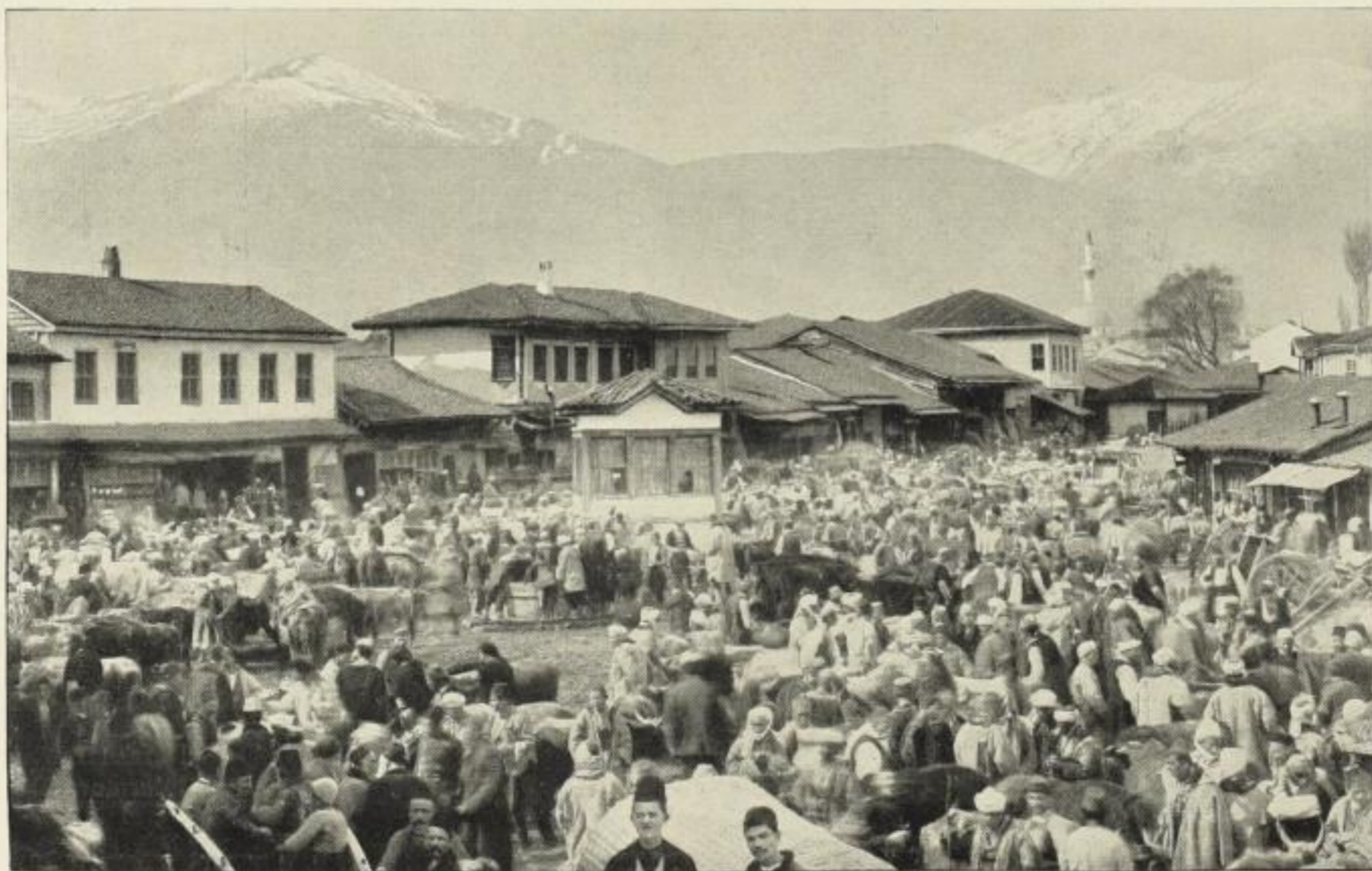
Marktplatz von Monastir. Im Hintergrund der schneebedeckte Peristeri.

M. 3.50 ord., M. 2.50 netto, M. 2.25 netto bar und 11/10. Illustrierte Kundenprospekte gratis.