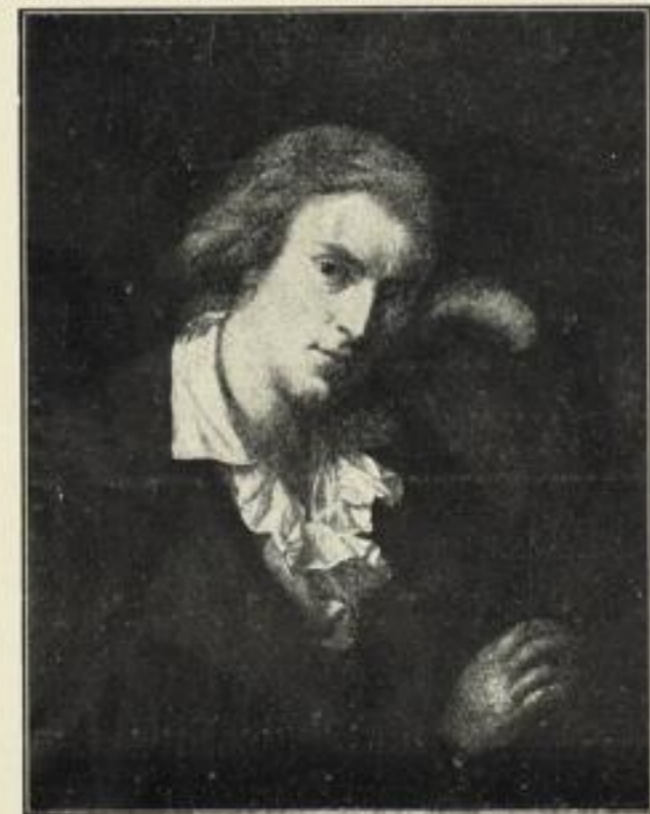
Anton Graff: Schiller.

Bildgröße: 74×94 cm. M. 50.— Auf Kupferdruckkarton: 100×120 cm.