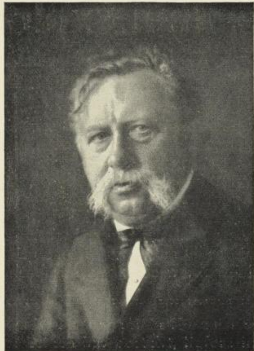
HERMANN KRETZSCHMAR Verfasser des „Führer durch den Concertsaal“

Wir bitten zu verlangen. Bestellzettel liegt bei.