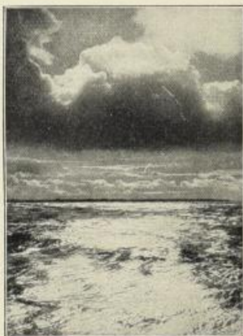
Wellen und Wolken.

Deutsches Verlagshaus Berlin - Charlottenburg.