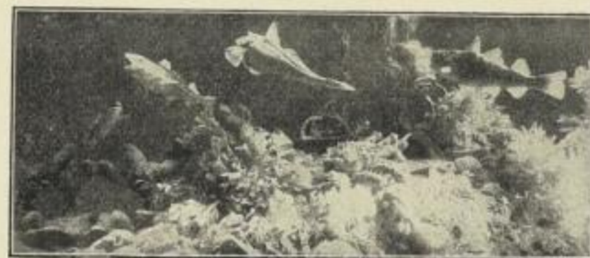
Bewohner des Meeresgrundes.

und Schüler sofort anschaffen werden, zumal das Unternehmen bereits die Förderung der massgebenden Kreise genießt. :: :: :: :: :: :: ::