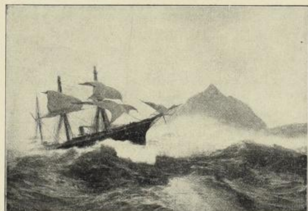
Am Kap der guten Hoffnung.