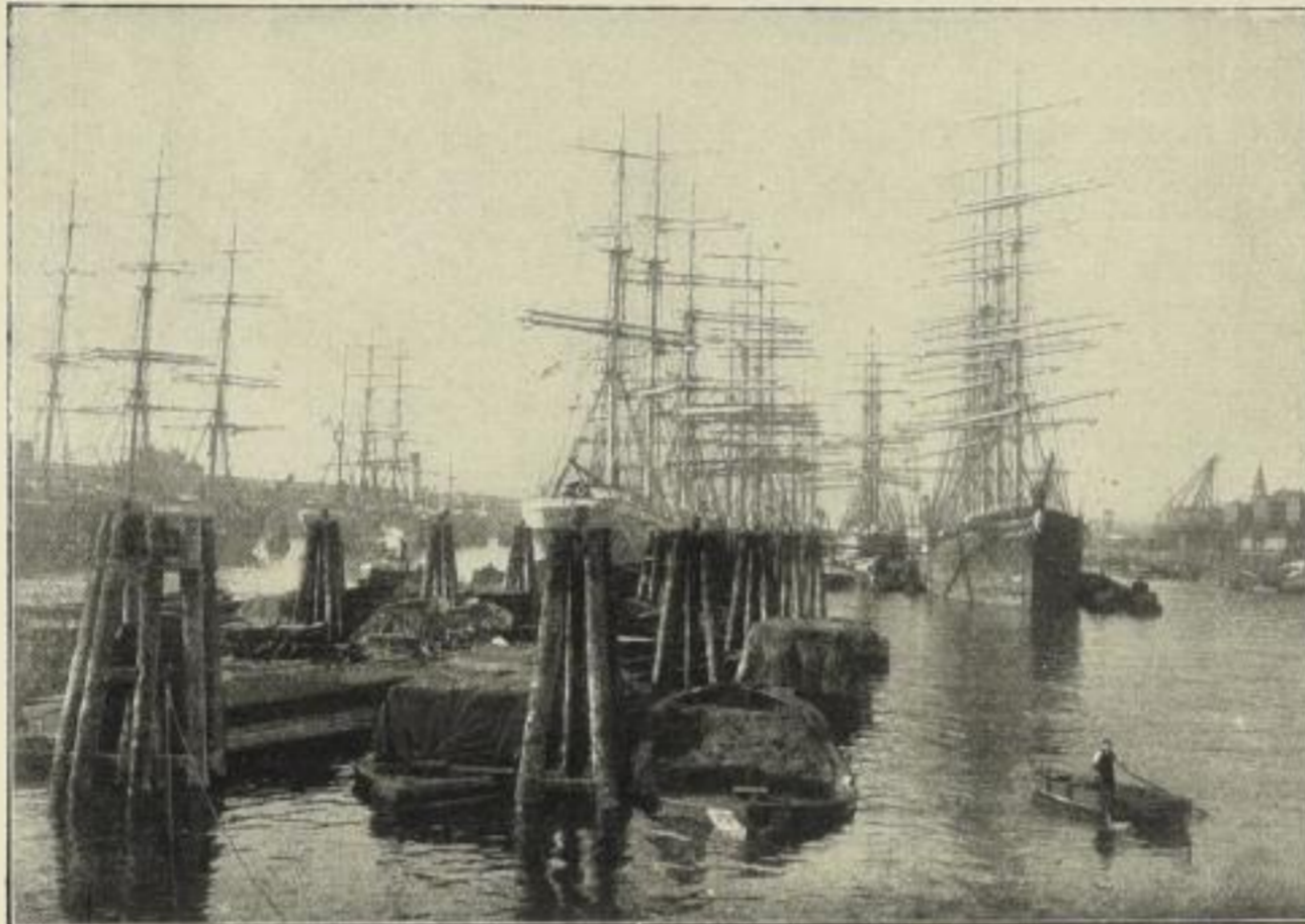
Der Freihafen von Hamburg.