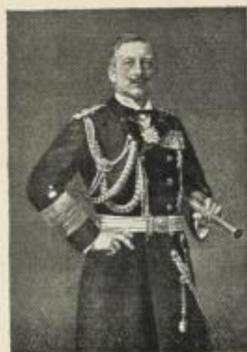
Wilhelm II. Deutscher Kaiser in Admirals-Uniform.