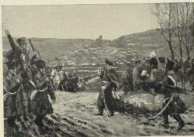
Blüchers Rheinübergang bei Caub