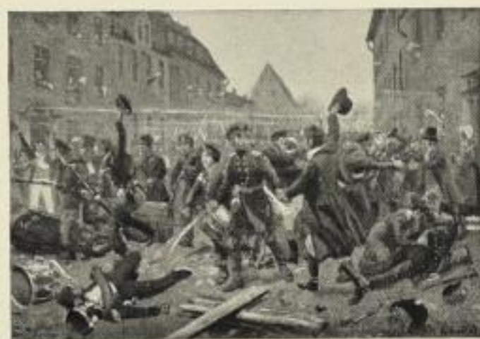
Die Königsberger Landwehr in Leipzig

Illustrierter Verlags-Katalog Mark 1.— ord., 50 Pfennig netto bitten zu verlangen.