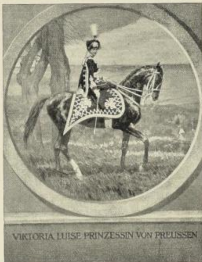
VIKTORIA LUISE PRINZESSIN VON PREUSSEN