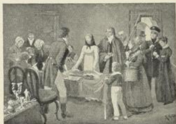
Opfergaben des Volkes