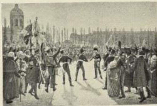
Das soll ein Wort sein