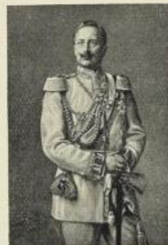
Wilhelm II. Deutscher Kaiser in der Uniform der Garde du Corps. Farbenkunstdruck nach einem Gemälde von R. Hahn. Bildgr. 36,5×52 cm. Kartonformat 50×70 cm.

Bildgrösse 36,5 × 52 cm, Kartonformat 50 × 70 cm Preis M. 2.— ord., M. 1.20 netto pro Blatt.